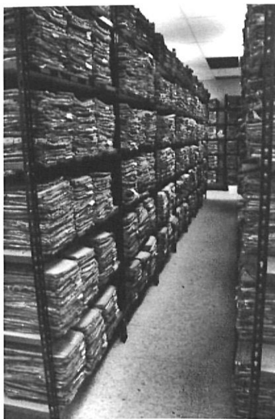
Així del Govern Militar de Barcelona.

Es començava un consell de guerra per la denúncia d'un veí a la Guàrdia Civil o a la Falange. També existia la possibilitat d'haver trobat llistes amb noms de persones que havien participat en la vida política o associativa del poble durant la República. La Guàrdia Civil anava a arrestar l'acusat, escorcollava el seu domicili i l'interrogava. Algunes vegades utilitzaven la força per obtenir i fer firmar les declaracions. Després demanaven informes sobre la conducta política i moral de l'acusat a l'Ajuntament, a la Falange, a la comandància de Carrabiner, o de la Guàrdia Civil si eren militars. Aquests informes incloïen una llista de persones que podien testificar els fets assenyalats en els escrits. La Guàrdia Civil convocava aquestes persones a declarar. Les denúncies i els informes s'enviaven al Tribunal Militar. Una altra vegada els denunciants anaven a testificar, feien declarar l'acusat i es feia un simulacre de judici, on els acusats no podien defensar-se. Jutjaven