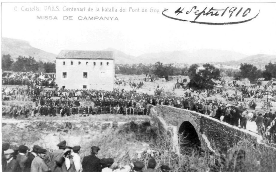
El pont de Goi i el molí durant la missa de campanya del 28 de febrer de 1809. Al fons, la tenda de campanya de la Creu Roja i al davant la plataforma des d'on s'oficià la missa.

Dos dies més tard, l'intent de Reding de tornar a Tarragona per l'estret de la Riba i l'antiga carretera que portava a Tarragona per la riba dreta del Francolí el va portar a establir contacte de matinada amb les avançades franceses que vigilaven el pont de Goi. Així es donà inici a una batalla que enfrontà prop d'onze mil soldats de l'Exèrcit espanyol, amb entre tretze i catorze mil de l'Exèrcit imperial. Si bé durant el matí els combats foren en general favorables a les tropes espanyoles, l'arribada de reforços imperials al migdia va equilibrar la situació, i va permetre a Gouvion Saint-Cyr llençar