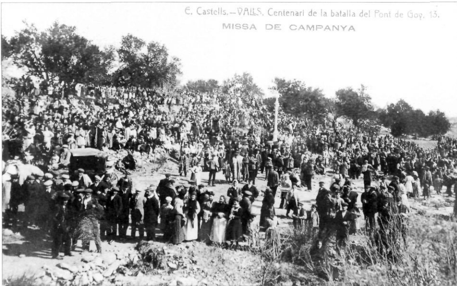
La creu commemorativa de la batalla del Pont de Goi, envoltada d'una multitud de persones que assistiren a aquell acte a la riba del Francolí.

president del Consell de Ministres, perquè així fos declarada condecoració oficial per part del Govern. El projecte va avançar força, ja que es va acordar el disseny que havia de tenir la condecoració, inspirat en el de la medalla que va concedir Ferran VII l'any 1815 a tots aquells que havien pres part en la batalla de Valls, i fins les diferents categories de la medalla (or, plata i bronze) i qui tenia dret a reclamar-la. 30