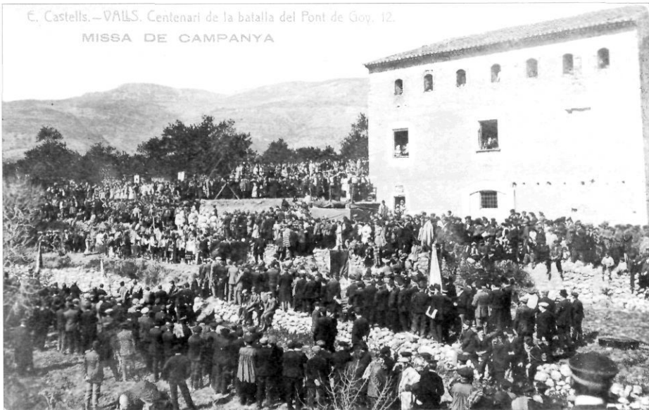
Diverses corals, balls populars, membres de la Creu Roja i públic en general, al moli. Al fons, la plataforma des d'on s'oficià la missa, amb un escamot de soldats, les autoritats i més públic.

Durant els dies següents, l'expectació que havien generat les festes es manifestà de nou en les diverses sessions de cinema en les quals l'empresa Cine-Valls projectà una pel·lícula que recollia els actes del centenari de la batalla del Pont de Goy. 23