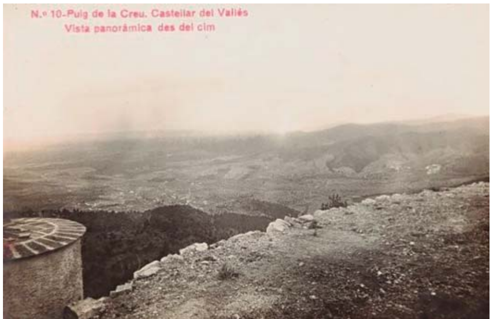
Vista panoràmica des del cim del Puig de la Creu cap a la dècada del 1920.