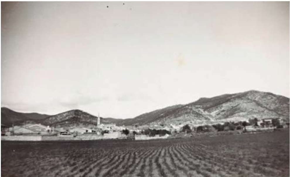
Vista general de Castellàr, amb el Puig de la Creu i els camps del Pla de la Bruguera. Antic camp d'aviació des de l'actual fàbrica del vidre fins a la gasolinera. Les parcel·les de conreus es van aplanar per fer el camp d'aviació, que era conegut com la Bruguerola.