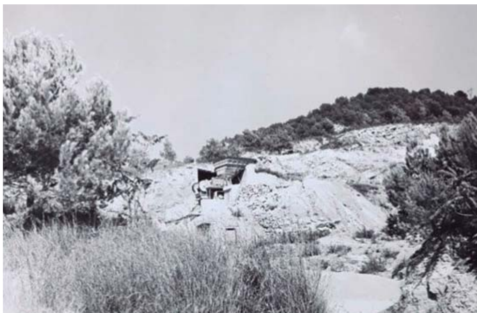
Forn de calç a la pedrera del Forn de Raig, en la dècada del 1970. || Autor: Joan Avellaneda Solé Font: fons família Avellaneda-Cos