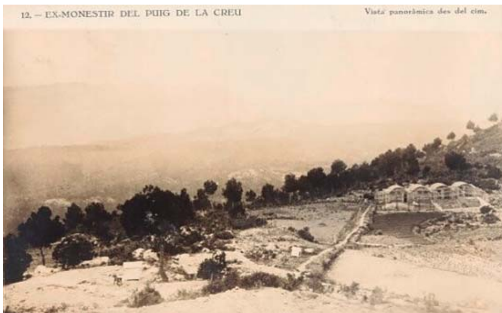
Vista des del monestir del Puig de la Creu, cap als anys 20.