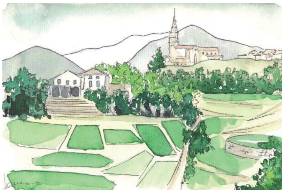
Aquarel·la a color de Castellà. || Autora: Jordina Pujol Perich