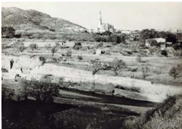
Vista de les vinyes i del Puig, al fons, l'any 1963. || Font i autor: Pere Genescà Foix