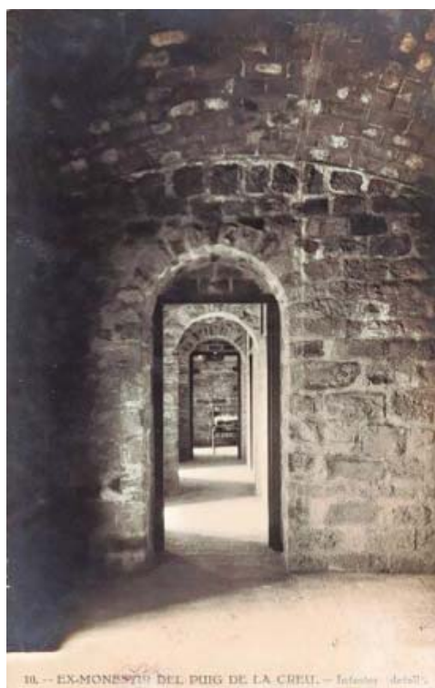
Detall del passadís interior del monestir del Puig de la Creu la dècada del 1920.

38. -- EX-MONESTIR DEL PUIG DE LA CREU. -- Fotografia detall.