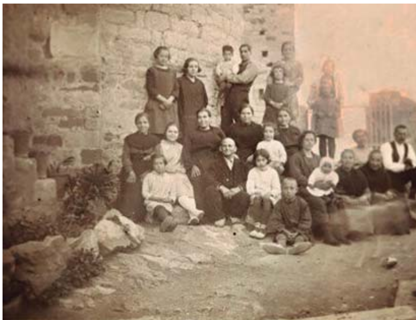
Excursió al Puig de la Creu, cap al 1925.