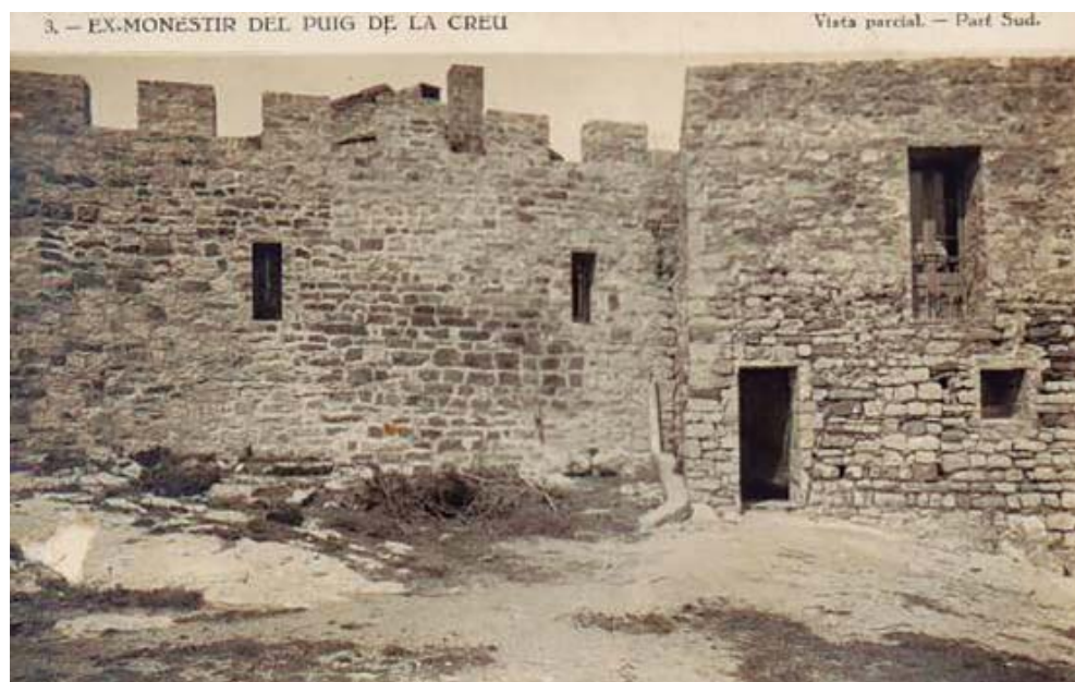
Vista parcial de la part sud del monestir del Puig de la Creu cap a la dècada del 1920. || Font: Arxiu Municipal de Castellar del Vallès