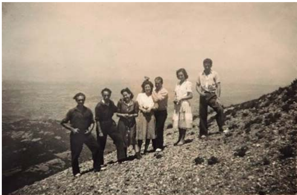
De camí al Puig de la Creu, cap al 1933.