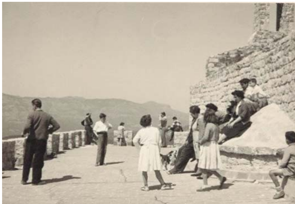
Setmana Santa al Puig de la Creu, cap al 1964.