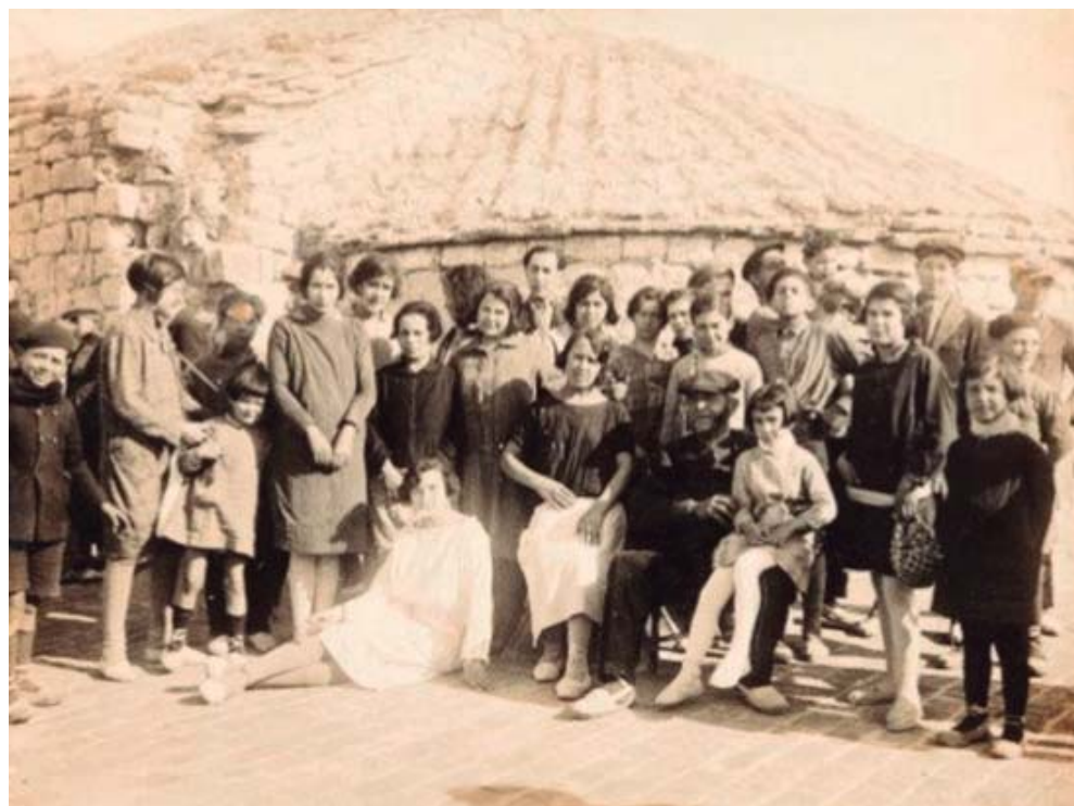
L'ermita del Puig de la Creu, amb el terrat força deteriorat, l'any 1937. És possible que la foto es fes durant una excursió de Setmana Santa.