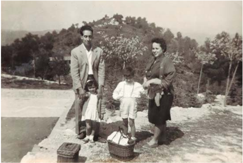
Excursió al Puig de la Creu, cap al 1961. A l'esquerra es veu la piscina i al fons, els porxos.