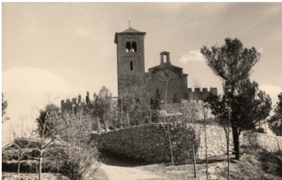
Vista del conjunt del Puig de la Creu, amb el mur en primer pla.