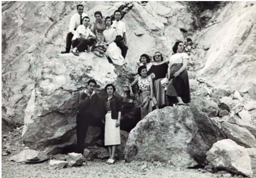
Un grup de joves es dirigien cap al Puig de la Creu i es van fotografiar a la pedrera del Cente. Els paletes encara en treien pedres per a la construcció.