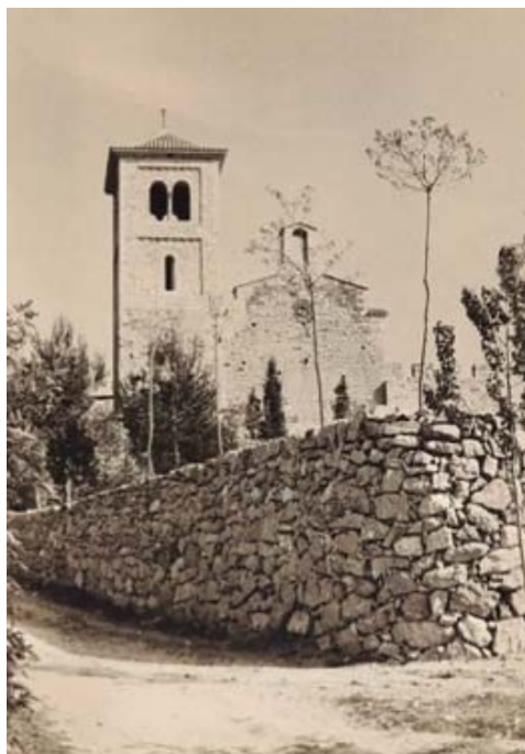
El Puig de la Creu, amb el mur de pedra seca en primer pla, el 1961. || Autor: Tomas Fabregas Font; fons Roser Galán Blázquez