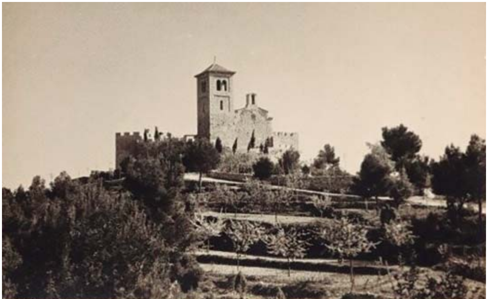
El conjunt arquitectònic del Puig de la Creu als anys cinquanta. La fotografia pertany a Roser Galán. || Autor: Tomas Fabregas Font: fons Àngels Sala Tuneu