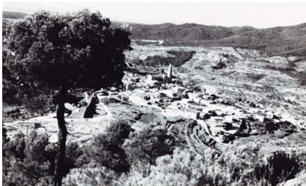
Vista general de Castellar des del camí del Puig de la Creu.