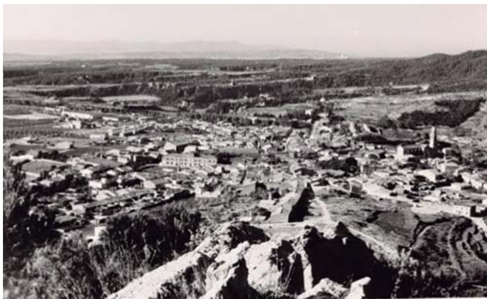
Foto des del camí dret del Puig de la Creu.