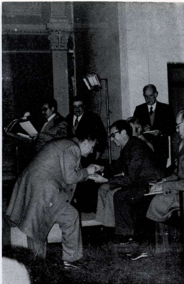
Vint-i-cinc anys del Grup Pessebrista. Entrega de medalles del Pare Abat Cassià Just.

L'any 1940, exposa per primera vegada a les Galeries Laietanes de Barcelona i, en aquest mateix any començà a exposar a Sabadell, Terrassa, Barcelona, Saragossa, Bilbao, Sant Llorenç de Morunys, Castellar del Vallès i altres llocs de la geografia catalana, amb notable èxit de públic i crítica.