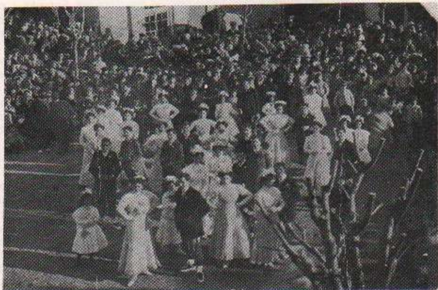
Vers el 1909