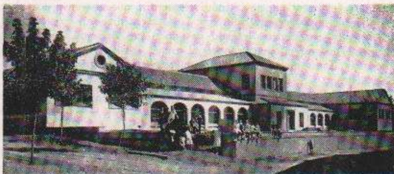
Vista del Grup Escolar Emili Carles-Tolrà.

Es per tot això que considero que, a l'acomplir-se enguany el 50è aniversari de la inauguració de les escoles nacionals, caldria que es restituís el seu nom primitiu com a signe de reconeixement a un gran castellarenc.