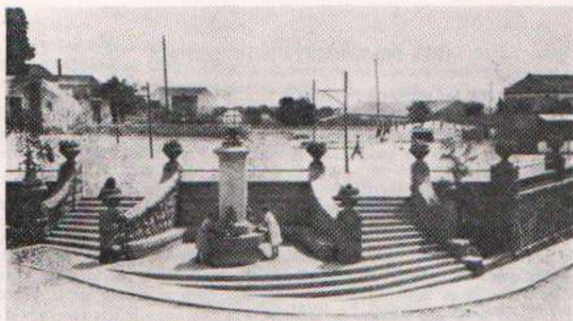
La font monumental de la Plaça Nova (actualment Plaça Major).