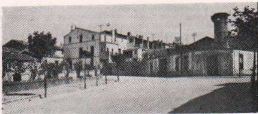
El Passeig, Cal Matescal i la Vallessana.