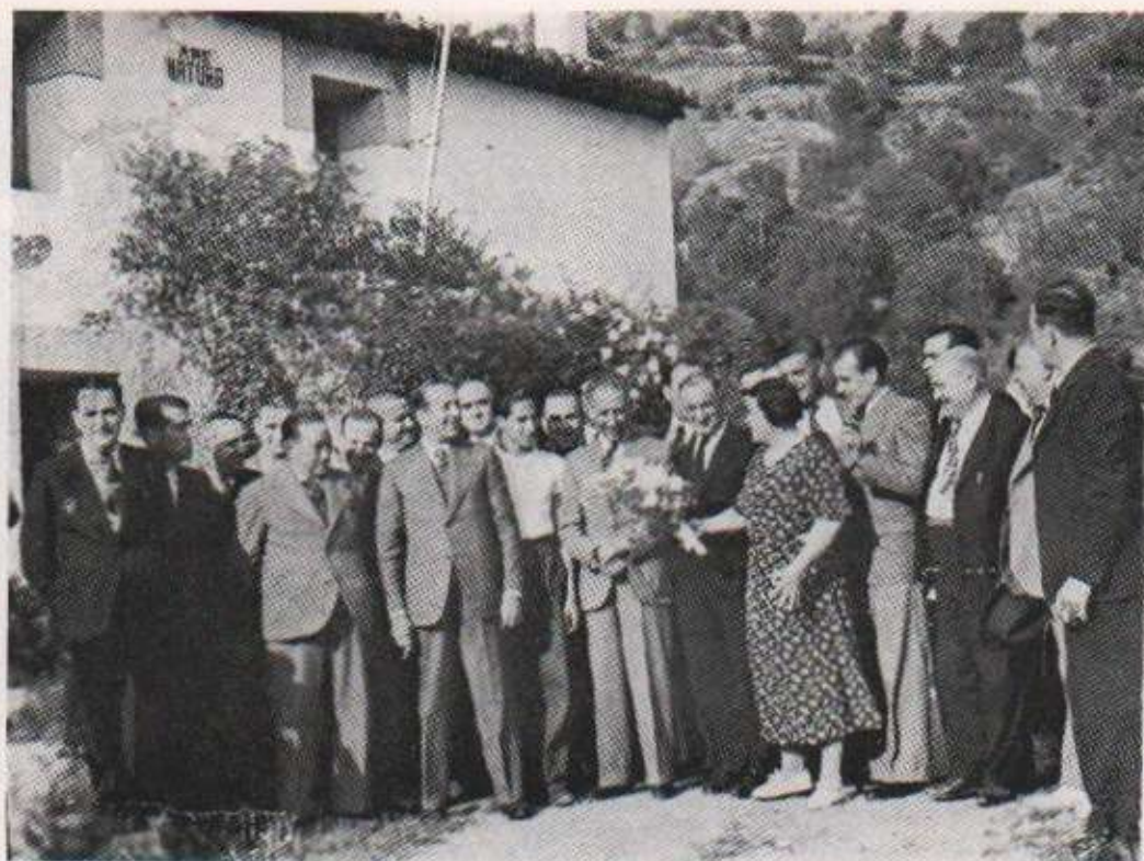
El President Lluís Companys visitant Les Arenes en companyia de les autoritats locals i d'un grup de periodistes barcelonins (16 de maig de 1936)

nunci i amb dos acompanyants armats amb fusells. No cal dir que tot el poble era al carrer comentant les notícies i els discursos escoltats a la ràdio que sonava fortament demanant voluntaris per a defensar la República i que acudissin a la Generalitat.