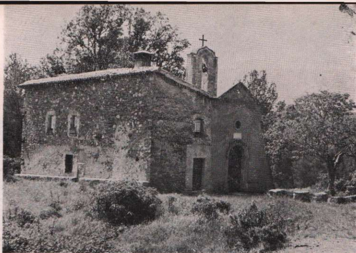
Vista de l'ermita

La semblança a l'anterior és notòria. La Mare de Déu vesteix túnica de color blau i el mantell que cobreix el seu cap i que baixa fins a les espatlles, és també del mateix color.