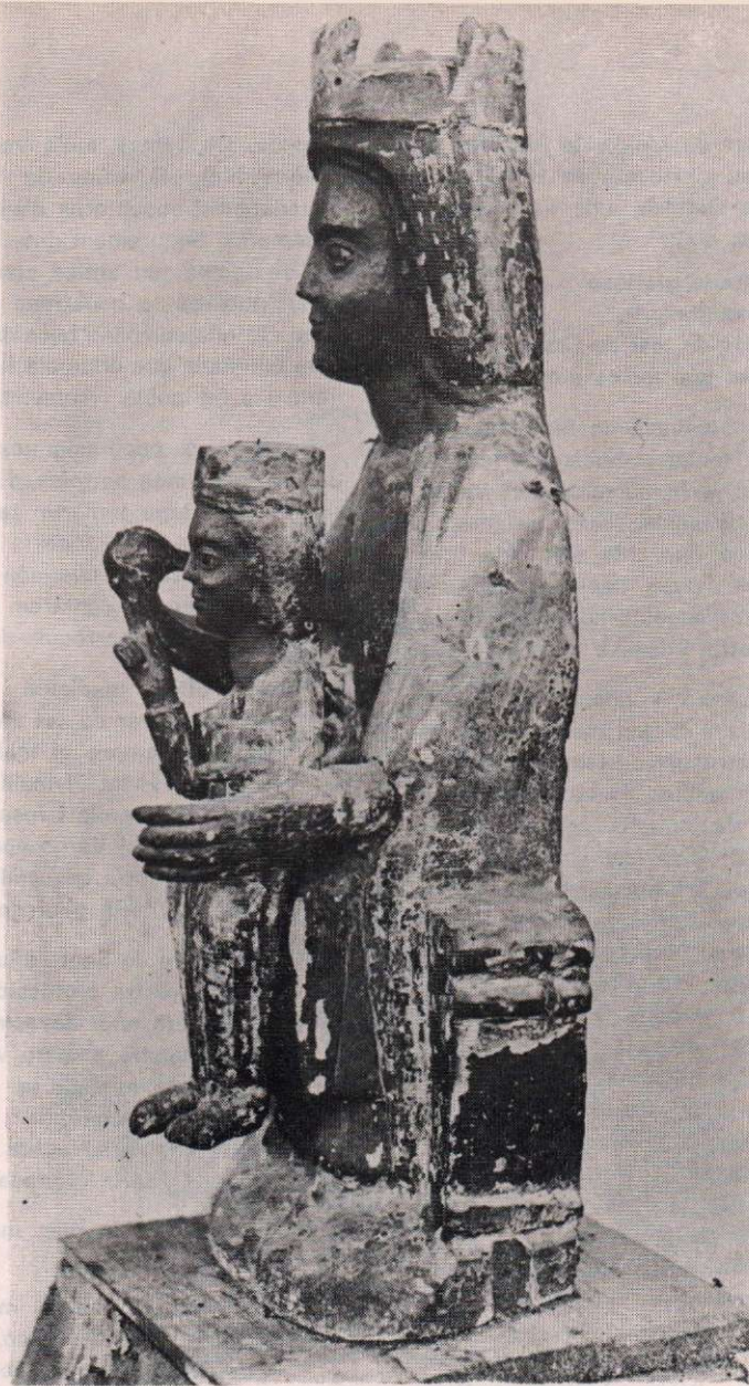
La primitiva imatge