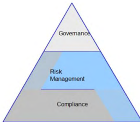
Fig. 1 GRC combine the disciplines of corporate governance, IT governance, information governance, risk management, security, data protection and compliance as an end-to-end process model. 15 La GRC combina les disciplines de la governança corporativa, la governança de les TI, la governança de la informació, la gestió del risc, la protecció de dades i el compliment normatiu com un model de procés integral.

gestió del risc. Durant molt temps, però, aquestes tasques complexes es van considerar àrees de treball individuals que es distribuïen entre departaments i càrrecs diferents i s'aplicaven a solucions específiques. Des d'aquesta perspectiva, es fa evident que cal una visió global de la companyia. Considerar per separat la governança, la governança de les TI, el compliment normatiu i el compliment normatiu de la gestió de la informació, la gestió del risc i la gestió de la qualitat no es tradueix en la transparència, la traçabilitat i la coherència necessàries. Per a l'aplicació en els processos i l'organització d'una companyia o administració, fa falta una visió global en què la governança proporcioni les normes i directrius, la gestió del risc les avaluï i el compliment normatiu en garanteixi l'aplicació pràctica i operativa.