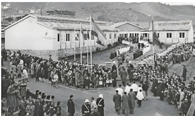
Inauguració de l'Agustina de Aragón

Però el Cardenal Cisneros ja va néixer amb "història". De fet, feia 17 anys que estava projectat i mai s'acabava de construir. La manca de places escolars públiques va fer que es multipliquessin les acadèmies privades, instal·lades en pisos i amb mensualitats que moltes famílies no podien pagar. Els barris reivindicaven la nova escola, tant és així que l'11 d'octubre de 1973, la premsa es va fer ressò dels escrits que els pares de Prosperitat, Verdum i Roquetes havien enviat a l'Ajuntament i la Delegación del Ministerio de Educación y Ciencia exposant el greu problema de l'educació en aquestes barriades. La resposta va ser que podien matricular als seus fills al Grupo Escolar Agustina de Aragón i al febrer ja estaria acabat el nou centre.