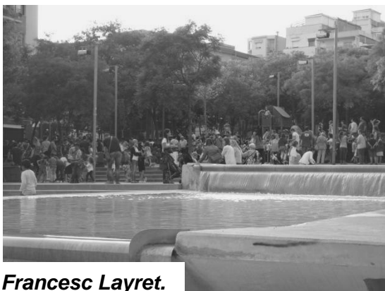
Plaça de Francesc Layret.

Però no va ser fins fa tres anys, més o menys que no vaig tenir l'oportunitat de col·laborar en les tasques de l'Arxiu Històric.