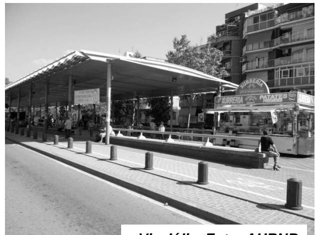
Via Júlia.

La primera que em va interessar va ser l'Arxiu Històric, i m'hi vaig fer sòcia. Al principi no coneixia ningú, però vaig tenir la sort de trobar-me amb la M. Lluïsa, que aleshores era la Presidenta, i a la Neus. Les dues em van fer costat i així, poc a poc vaig començar a anar a les sortides i agafar confiança.