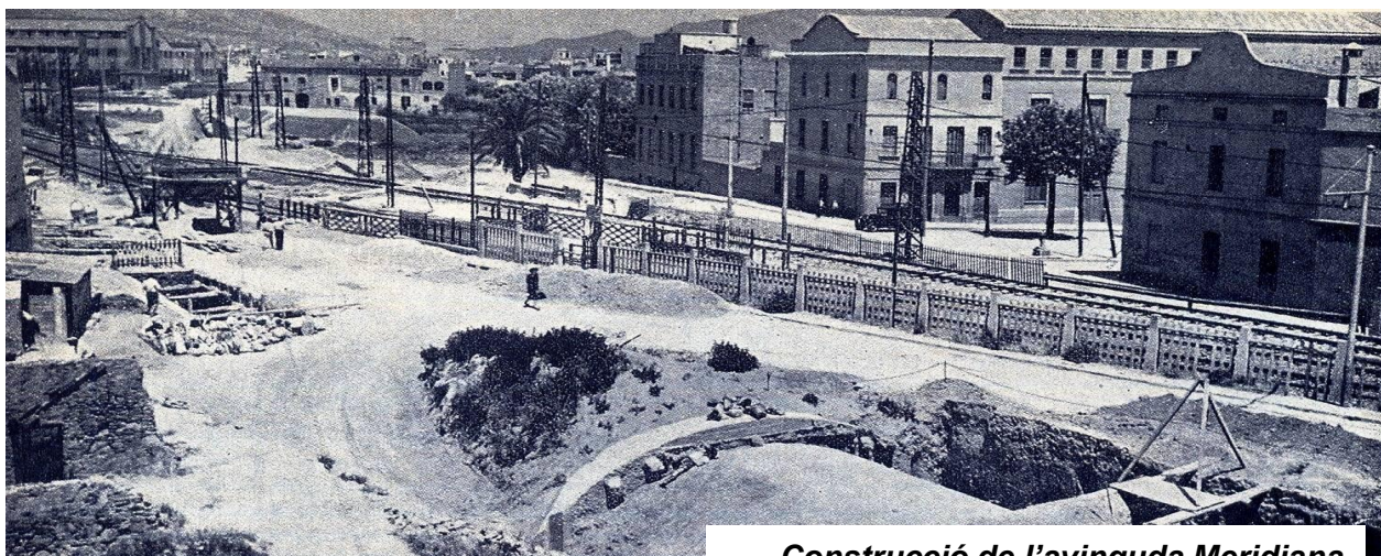
Construcció de l'avinguda Meridiana