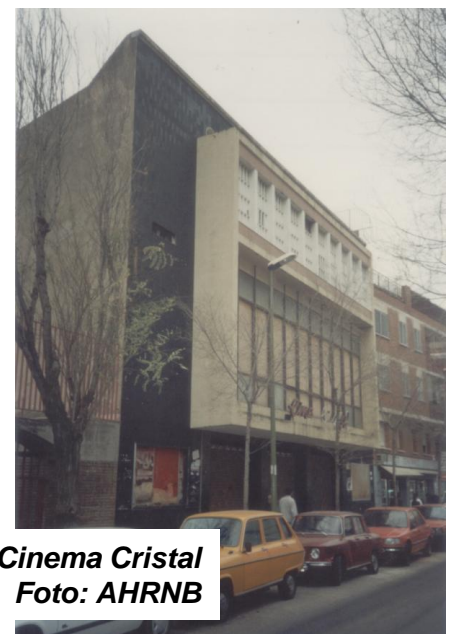
Cinema Cristal