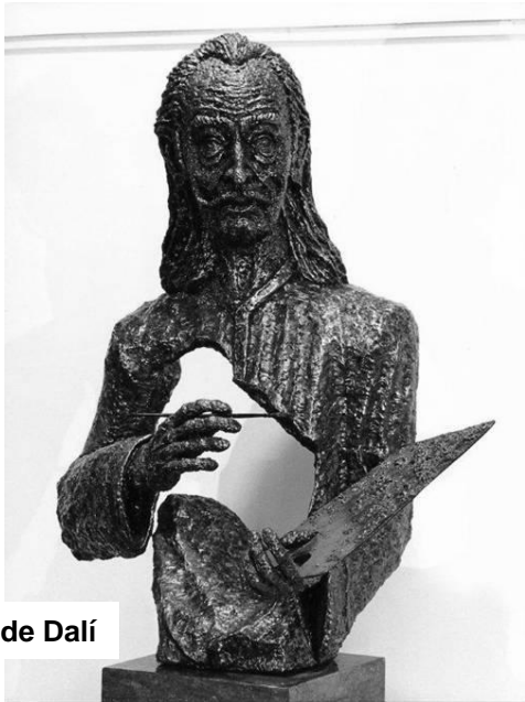
Escultura de Dalí

Para concluir, transcribiré unas palabras del crítico de arte Sr. Ángel Marsá, en referencia al escultor de Nou Barris: “La escultura plástica tridimensional, enlace volumen-espacio, exaltación, sublimación de la naturaleza, dominio del hombre sobre la materia inerte.