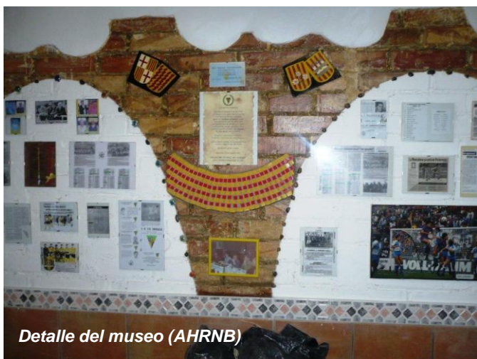
Detalle del museo

-Montañés, fundado en 1948. Camiseta a franjas verticales estrechas rojas y blancas, y pantalón negro. -Nacional, jugaba en el campo de la Montañesa. -Nilo, que jugaba en un campo donde actualmente están la plaza de los Jardines de Alfabia cerca de la calle de Alcudia. -Olympic, jugaban en el campo del Alzamora. -Pegaso, jugaba cerca de la calle del Padre Mañanet en el campo del Centro de Formación Profesional. -Penitentes, jugaba en el campo de la Teixonera, debajo de la bóvila que había en el Valle de Hebrón. -Peña Atlético, que jugaba en el campo de Canyellas y tuvo la sede en el bar Gama de la calle de Enric Casanovas. -Peña Bética, en la Montañesa. -Peña Blaugrana. Antes Cerro y actualmente Penya Blaugrana Trinitat Vella. -Peña Elche, fundado en 1966 jugaban el Trinitat Nova, actualmente el terreno está ocupado por un parque placas solares y demás instalaciones de la Compañía de Aguas. -Peña Font, jugaba en el campo del Sant Andreu. -Peña Granada, con sede al final de la calle de Argullós, que se prolongaba a través de la actual avenida de Río de Janeiro, en las pistas de petanca. -Peña Latina. -Peña Reyes, jugaba en campo Roquetas. -Atlético Piferrer, fundado en 1966. -Prosperitat, que jugaba en el campo de la Peña Elche.