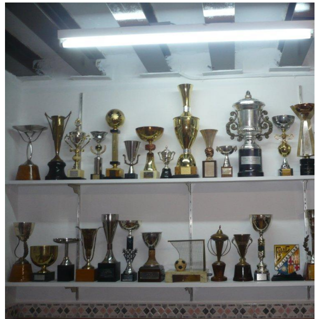
Vitrina de trofeos

Pudo ver inaugurado por fin su museo el 25 de junio de 2011. La noticia fue difundida por BTV que, en alguno de sus noticiarios presentaron imágenes del mismo que nos retrotraen a los tiempos heroicos del fútbol de barrio en que bastaba un terreno baldío de tierra, unas porterías, un recinto cubierto próximo que sirviera de vestuario para los jugadores (con suerte provisto de ducha, eso sí, con agua fría) y un local (generalmente un bar) para reunirse y llevar la organización y administración del club. Los balones, de cuero cosido llevaban una vejiga de goma que se hinchaba con una mancha o bombín manual (como la empleada en las ruedas de las bicicletas) y se introducía la boquilla cerrada con un cordel. Luego se cerraba la abertura del balón con los cordones. Algunos jugadores se ataban un pañuelo blanco a la cabeza para no hacerse daño al rematar o despejar un balón con la frente. Los balones se mantenían elásticos mediante la aplicación de grasa de caballo. Esto duró hasta principios de los años 60 del pasado siglo