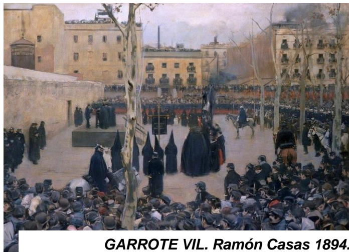
GARROTE VII. Ramón Casas 1894. Oli sobre tela 127x166. Museu Reina Sofía

La presó de la Reina Amàlia (o popularment dita Presó Amàlia) va ser un centre penitenciari massificat i de condicions inhumanes també conegut com a Presó Vella o La Galera.