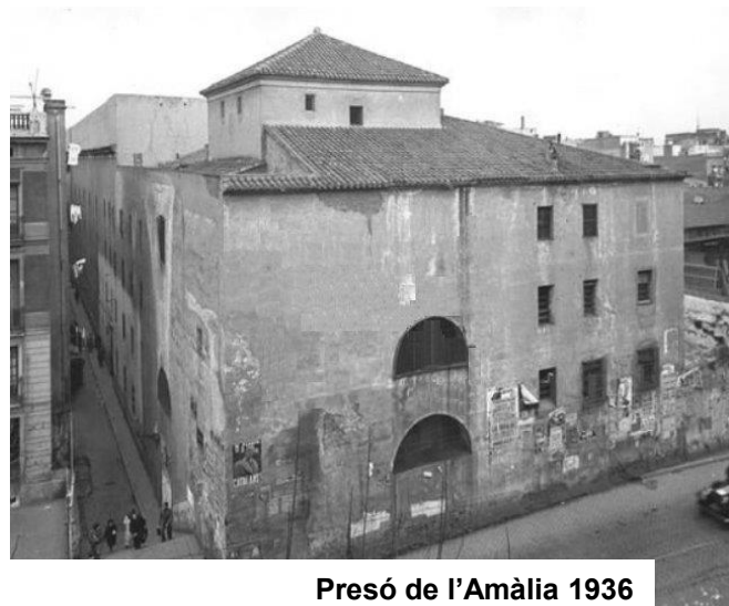
Presó de l'Amàlia 1936