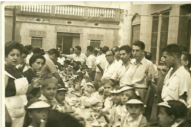
Veïns de festa davant de la casa, al carrer Borges