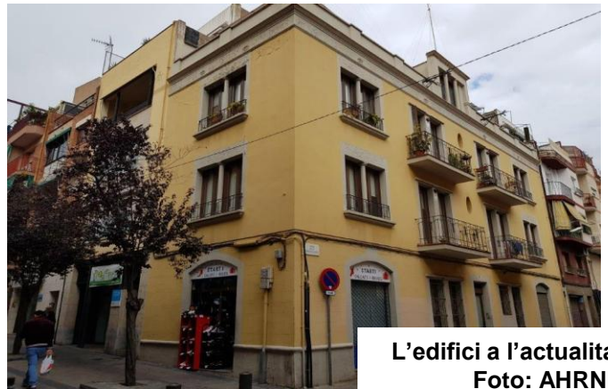
L'edifici a l'actualitat

El dia 22 de juliol de 1936, com a conseqüència de la revolta militar contra el govern legítim de la República, militants anarquistes de la ciutat de Tarragona, esperonats per milicians armats vinguts de Barcelona, van obrir les portes de la presó i van alliberar tots els reclusos sense distincions, tant polítics com comuns. Tanmateix, quatre dies més tard d'aquesta acció que simbolitzava la revolució, ingressarà el primer intern acusat d'activitats feixistes: la presó es tornava a omplir