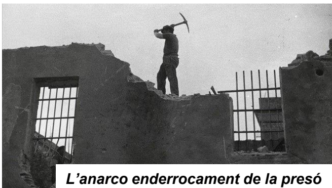
L'anarco enderrocament de la presó