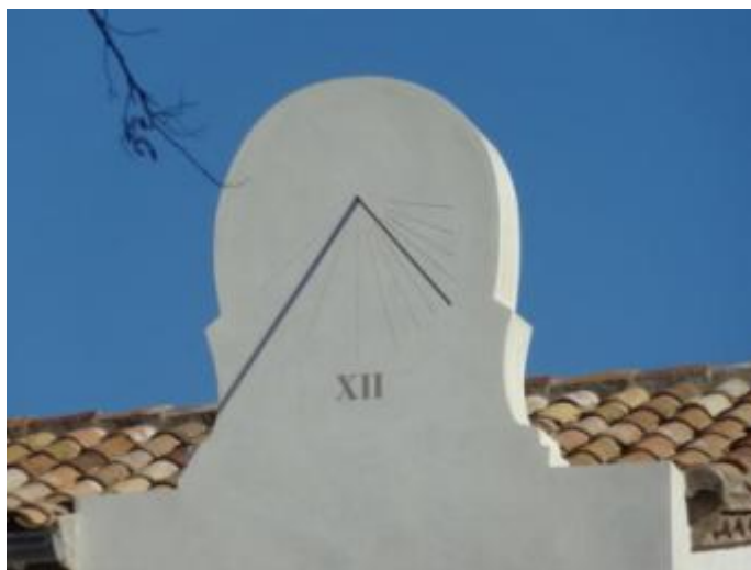
Rellotge de sol a Can Verdaguer

L'altre rellotge o rellotge de ponent passa desapercebut. Es troba situat a la façana sud-oest, latitud 41,434033 i longitud 2,179133 amb referència 1952 en l'inventari. Aquest rellotge va ser enderrocat en les obres de rehabilitació de l'edifici i la teulada, tornant a ser dissenyat i calculat de nou per Nasi Vilà, gràcies a la col·laboració ciutadana que van donar l'avís de la seva