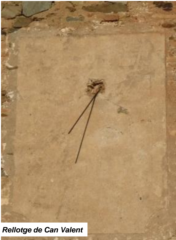
Rellotge de Can Valent

Malgrat, que Nou Barris no disposa d'un ric patrimoni de rellotges de sol, compta amb dos exemplars més, a destacar per diferents aspectes. El situat al passatge del Dr. Pi i Molist i un horitzontal ornamental, ben curiós.