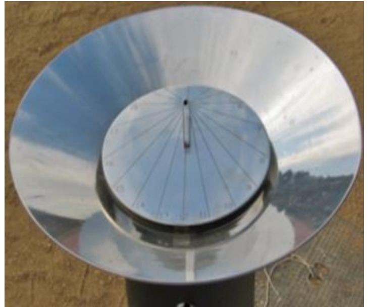
Font Parc Central

Va ser un encàrrec de l'Ajuntament de Barcelona a l'empresa Escofet 1886, S.A. Disseny dels arquitectes Arriola & Fiol. El conjunt del sortidor que fa les funcions de gnòmon, es prolonga en l'arc d'aigua que neix de la