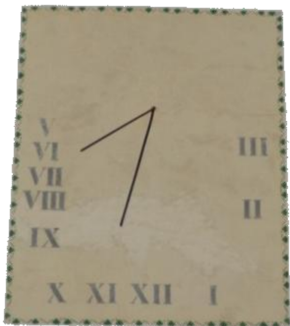
Rellotge de sol a Can Verdaguer

Ja es conegut per tots els lectors de la revista, el passat clarament rural de Nou Barris. De les 26 masies o cases senyoriales situades al Districte de Nou Barris, actualment perduren 7, on només en dues de les quals, a les masies de Can Verdaguer i de Can Valent, podem continuar observant aquest extraordinari enginy humà.