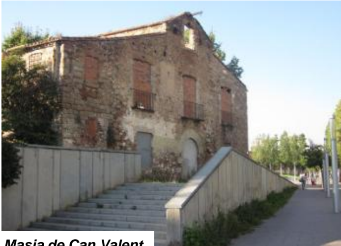
Masia de Can Valent

marques horàries ni cap rastre decoratiu, en el cas que hagués existit, actualment s'hauria esborrat. Malauradament, encara que la masia està inclosa en el catàleg del Patrimoni Arquitectònic Historicoartístic de la ciutat de Barcelona, amb categoria B capítol II número 0345, el seu estat és deplorable.