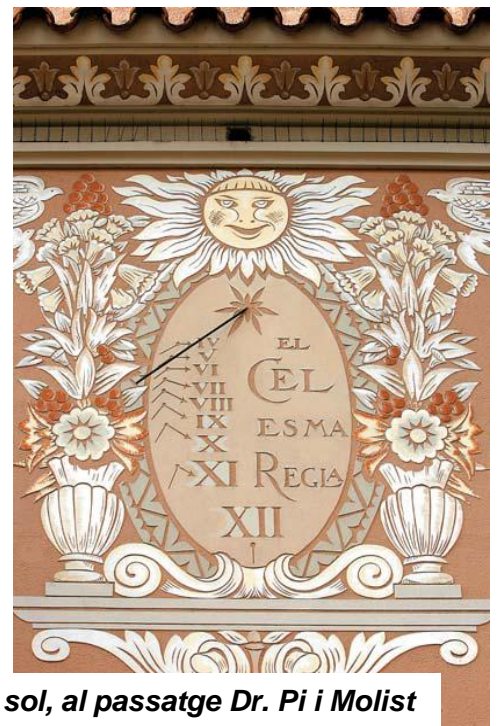
Rellotge de sol, al passatge Dr. Pi i Molist

(Significa: Una parte para el reposo, otra para el trabajo.)