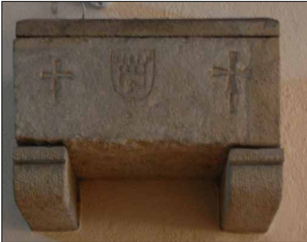
Fig. 05. Sarcòfag de Santa Maria de Pineda.

La família dels Montpalau, Monpalau o Mompalau van ser cavallers i castlans del castell homònim situat al cim del turó de Montpalau, a Pineda de Mar.