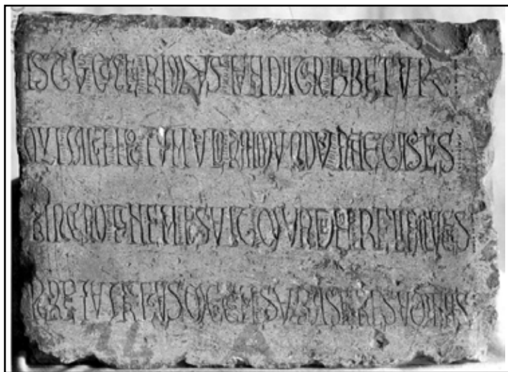
Fig. 11. Làpida fundacional de Roca Rossa (Tordera) [Pladevall, 1992].

«ISTIUS ECCLESIE PRIMUS FUNDATUR HABETUR / QUI IACET HOC TUMULO RAIMUNDUS NOMINE GASCUS / PRINCIPIO FINEM POSUIT MUNDANA RELINQUENS / PERPETUI FRUCTUS MERCEM SUPER ASTRA RESUMENS» 40