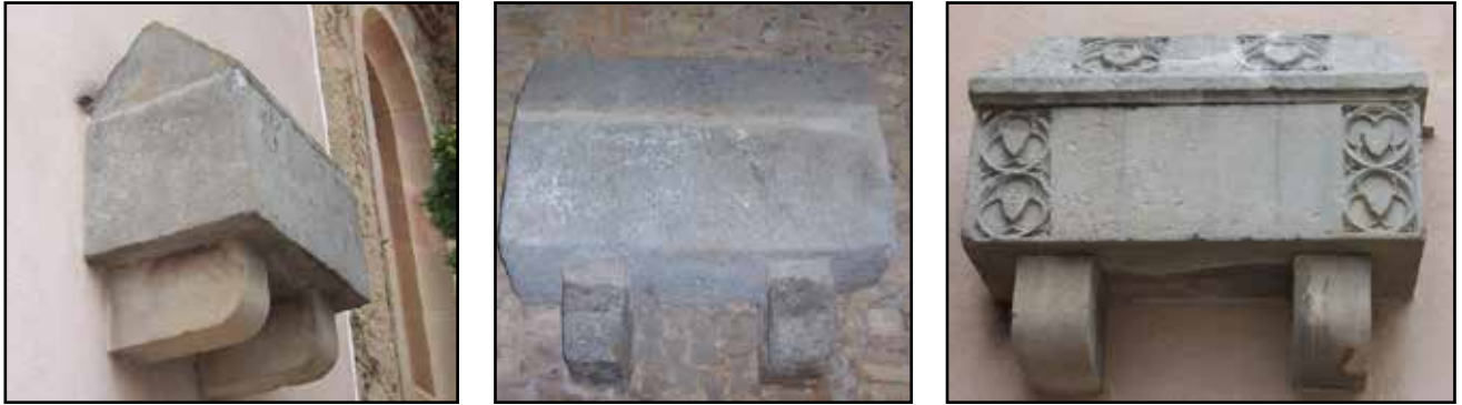
Fig. 2. Sarcòfag de Sant Pere de Clarà: núm. 1, 2 i 3, respectivament.