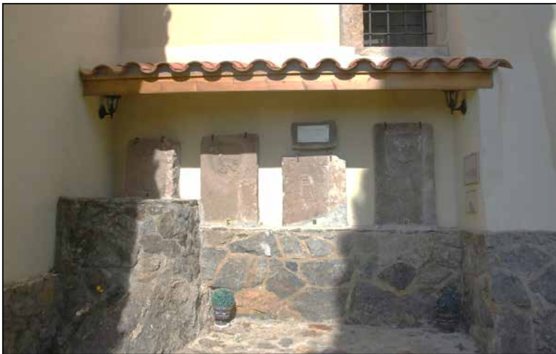
Fig. 07. Conjunt de làpides de Sant Pere de Riu (Tordera).

Tres d'aquestes lloses (1, 2 i 3) estaven situades en el tercer graó d'accés a la porta que es va obrir en la reforma barroca de l'edifici, l'any 1774. Les altres dues (4 i 5) es van recuperar l'any 1988, amb unes obres de rebaix del presbiteri, i també s'havien reutilitzat com a graons per pujar a l'altar presbiteral. Actualment estan museïtzades i exposades al pati d'entrada del temple, adossades al mur de la masia rectoral annexa.