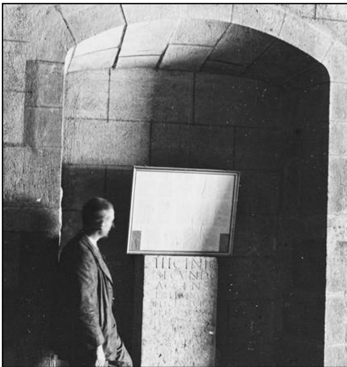
Fig. 03. Sarcòfag de Llavanes [fotografia: Josep Salvany i Blanch, 1912 [fotografia: BC - Fons Salvany SaP_043_07].