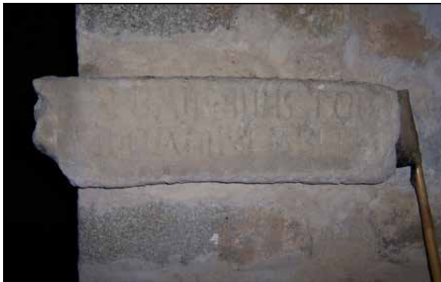
Fig. 13. Làpida fundacional de Baio a Sant Pere de Clarà.

Sembla que Baio era un prevere mossàrab que a l'entorn del 874 s'havia instal·lat a Terrassa, on exercia funcions reservades al bisbe, intentant ressuscitar l'antiga diòcesi d'Ègara. Aquest fet el va portar a ser denunciat pel bisbe Frodoí de Barcelona i castigat al sínode d'Attigny del 874. Aquesta làpida, doncs, ens porta a establir els orígens del monestir cap al segle ix. 43