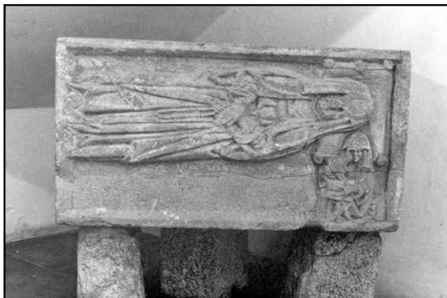
Fig. 06. Sarcòfag de Sant Martí de Teià.