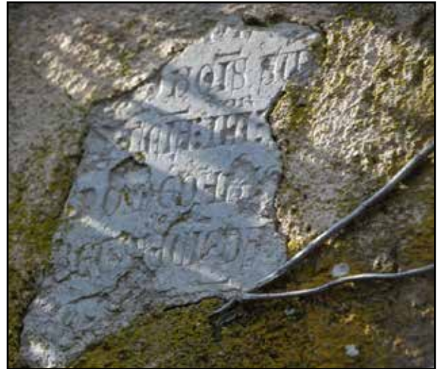
Fig. 12. Làpida fundacional de la capella de Sant Pere de Sant Genís de Palafolls.

De la làpida se'n va perdre el rastre fins que Xavier Soldevila en va localitzar un fragment en un dels contraforts exteriors del mas Reig, de Sant Genís de Palafolls. Alfons Codina va publicar la referència de la troballa i va relacionar el fragment amb la làpida esmentada. 42