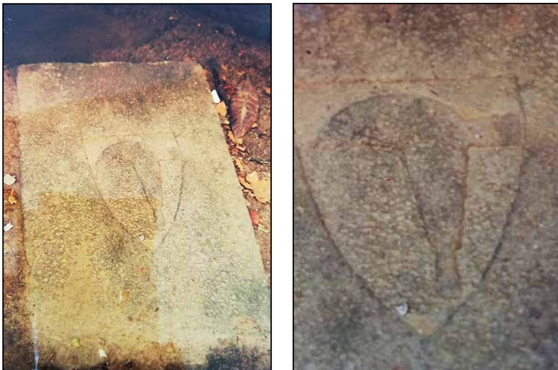
Fig. 09. Làpida de Sant Feliu d'Alella.