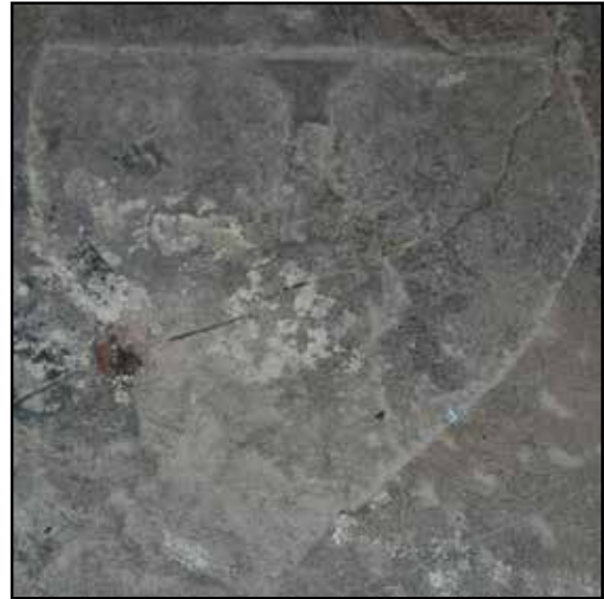
Fig. 10. Làpides de Sant Genís de Palafolls.