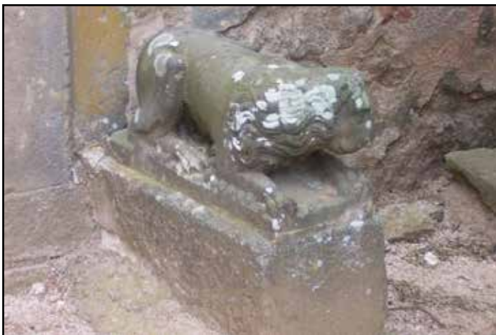
Fig. 04. Escultura d'un lleó del suport del sarcòfag.