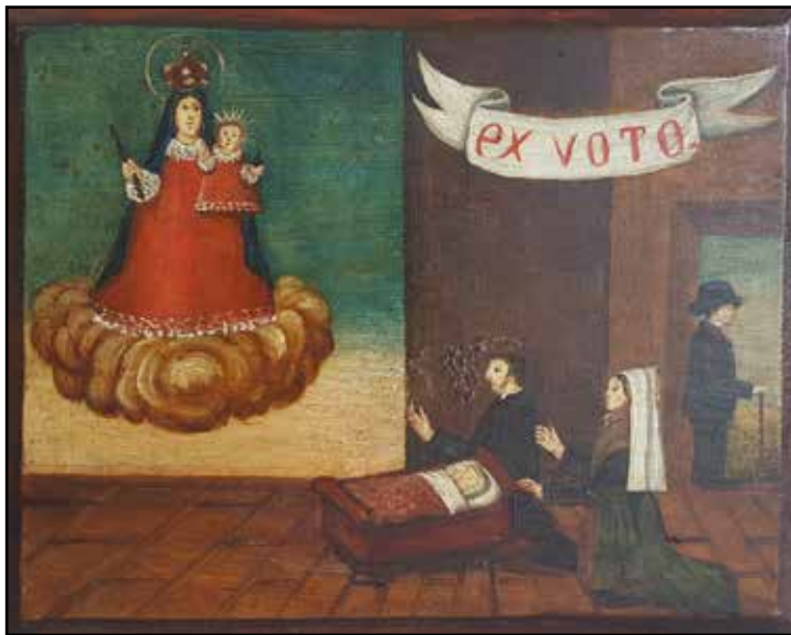
Exvot segle XIX

Si ara comparem les 359 defuncions de cossos i albats recollides al Llibre de l'Obra entre el 1568 i el 1578, i les comparem amb les 125 que consten al Llibre 1 de Defuncions per al mateix període, veurem que el Llibre de Defuncions només recull una mica més d'un terç del total de defuncions. Aquesta comparació ens mostra com d'inexactes són les dades amb les quals treballem i com de limitades poden ser les nostres conclusions.