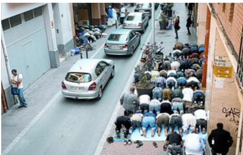
Musulmans resant al carrer, a França (2008)

Una de les mesures fonamentals de l'estricta separació entre Estat i Esglésies és, segons l'article 2 de la Llei de 1905, la negació de tot finançament (salari o subvencions) a les associacions religioses.