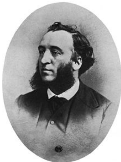
Jules Ferry (1832-1893)

La laïcitat francesa del segle XX estableix una escola pública laica i la supressió de l'ensenyament religiós a l'escola pública (des de la Llei de Jules Ferry, de 1882). I, en l'àmbit escolar, la supressió dels símbols religiosos en espais públics ha arribat a la prohibició de portar símbols religiosos ostentosos, també a l'alumnat, en tots els centres educatius públics (Llei del 15 de març de 2004). En l'àmbit dels cementiris, la laïcitat francesa prohibeix la creació de parcel·les confessionals a l'interior dels cementiris (que són de competència municipal).