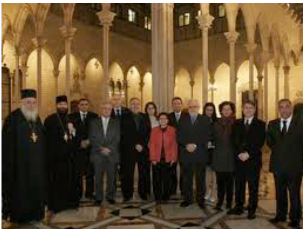
Representants de diferents confessions religioses al Palau de la Generalitat

Aquesta laïcitat inclou la relació i la col·laboració amb totes les confessions religioses i altres opcions de pensament, com en el model espanyol, però, a diferència d'ell, no estableix graus de reconeixement i de col·laboració, sinó que tracta totes les tradicions religioses amb el mateix respecte institucional i des de la neutralitat pel que fa a les creences. Perquè un govern no és qui per decidir quina és la veritat teològica ni quins són es millors arguments ateu, i sí que, en canvi, ha de vetllar pels drets de la ciutadania.