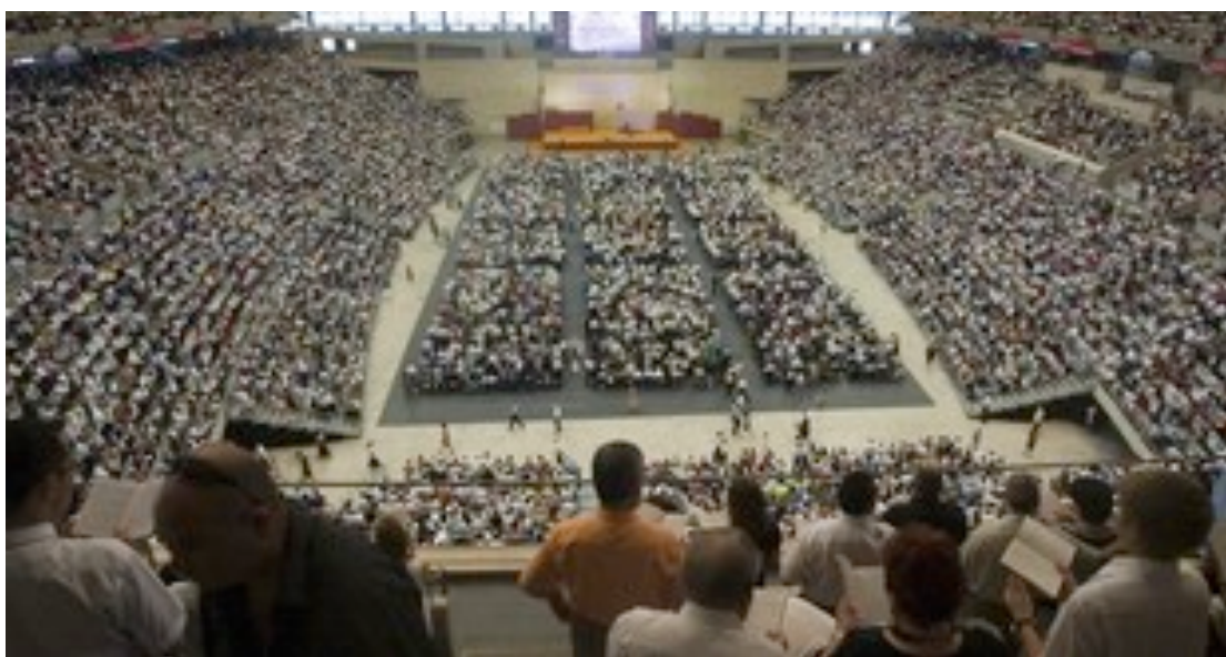
Congrés anual dels testimonis de Jehovà a Barcelona (2009)

Els tres Acords del 1992 signats, respectivament, amb Federación de Comunidades Israelitas de España , Comisión Islámica de España i Federación de Entidades Religiosas Evangélicas de España , amb algunes diferències entre ells, reconeixen entre altres, i respectivament, els llocs de culte de les entitats d'aquestes federacions i la seva inviolabilitat; els mateixos beneficis legals per als cementiris islàmics i jueus que els llocs de culte; el dret a parcel·les en els cementiris municipals per a enterraments jueus i islàmics; les figures dels imams, rabins i pastors i el seu dret a ser inclosos en el règim general de la Seguretat Social; els efectes civils del matrimoni religiós; l'assistència religiosa a les forces armades, als centres penitenciaris i als centres hospitalaris; el dret a rebre ensenyament religiós en els centres públics, amb professors designats per les comunitats religioses; determinats beneficis fiscals; i la possibilitat de canviar les hores de treball de determinades festivitats religioses, així com de no assistir a classe i de canviar les dates d'exàmens.