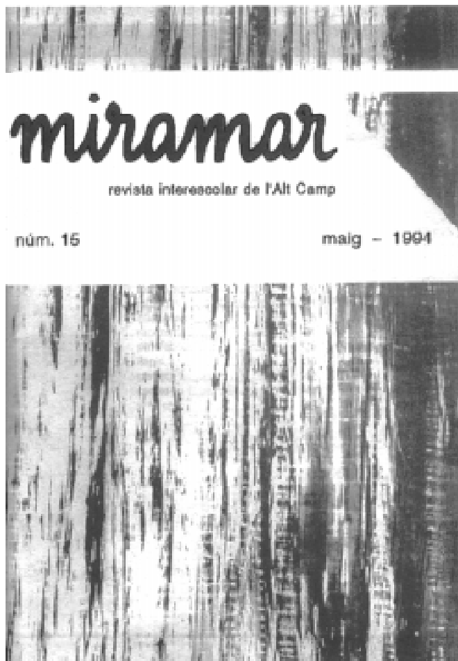
Centre de Recursos Pedagògics de l'Alt Camp Passeig dels Caputxins, 19 Valls

Els grups de treball són grups reduïts de persones que tenen com a objectiu principal l'elaboració d'un material concret per a una tasca pedagògica determinada. Tenen una continuïtat més llarga.