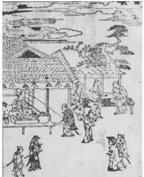
Figura 5. Imagen de un niuri chaya sobre 1662. Obra de Asai Ryoji. En “ Izakaya no tanjō ”, 48.

Desde sus inicios, las tiendas de té tuvieron una función principal de crear espacios de descanso, para lo cual se ofrecía principalmente té acompañado de comidas ligeras. De esta forma, estas estaban más orientadas a los viajeros, los cuales encontraban en estos establecimientos un punto de descanso, pero durante el periodo Edo, fueron aumentando su presencia en las ciudades, donde se convirtieron en focos de ocio y sociabilidad 84 . Dentro de estas tiendas de té, una categoría serían las niuri chaya (煮売茶屋, lit. “Tienda de té y productos hervidos”) (Figura 5), las cuales se especializarían en servir té y un menú de comida más amplio que otros establecimientos, como las licorerías 85 . Relativo a estas niuri chaya y su presencia en ciudades como Edo, de acuerdo con lino, se puede rastrear su inicio sobre el 1657, año del “gran incendio de Meireki”, considerado el mayor incendio del periodo Edo. Este incidente también causó un gran aumento de la población de la ciudad de Edo, especialmente, hombres que acudieron a la