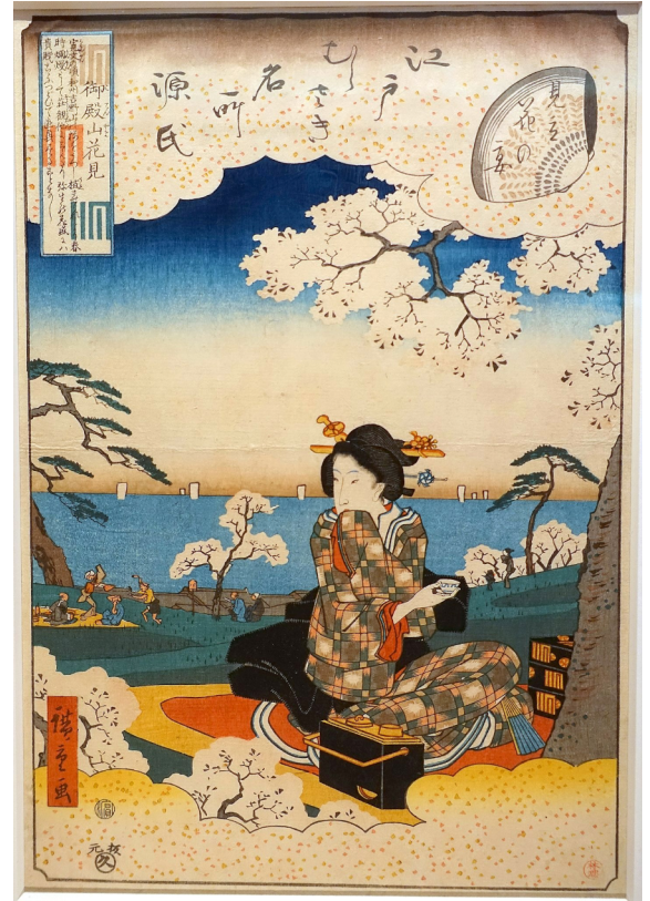
Figura 1. Mujer haciendo hanami mientras toma sake. Obra de Utagawa Hiroshige. Cherry blossom viewing at Gotenyama (Última consulta el 13 de mayo del 2024).

Siguiendo con el consumo de sake anclado a eventos concretos del año, se encontraban también la floración de los cerezos (花見, hanami ), espectáculos de fuegos artificiales (花火, hanabi ) o la caza de luciérnagas (蛍狩, hotarugari ). Estos eventos, en algunos casos, se remonta a etapas anteriores al periodo Edo. Por parte del hanami , aunque difícil de localizar su origen exacto, es un acto que se lleva a cabo desde tiempos pretéritos, posiblemente relacionado con comunidades de agricultores, y que se extendió hasta el periodo Asuka y Nara, donde no solo los cerezos, también otras plantas como los ciruelos eran apreciados 29 . Por parte del hanabi , según comenta el profesor Yoshida Tadao, empezaría a darse al poco de la llegada de la pólvora por parte de los europeos en el 1543, aunque al no ofrecer una fecha exacta, queda supuesto que sería una fecha próxima o muy temprana del periodo Edo 30 . Por último, el hotarugari , de acuerdo con las referencias que ofrece el Nihon Kokugo Daijiten podría tratarse de un evento más propio del periodo Edo, en concreto, se tienen datos al menos a partir del 1695 31 . No obstante, sean o no particularidades del periodo Edo, lo que queda claro es que son eventos populares que tenían su momento de celebración marcado en el tiempo. Además de ello, como se observará en diversos ukiyo-e (浮世絵, lit. "Pinturas del mundo flotante") (Figura 1), la comida y el sake aportaban un elemento importante en el acto 32 .