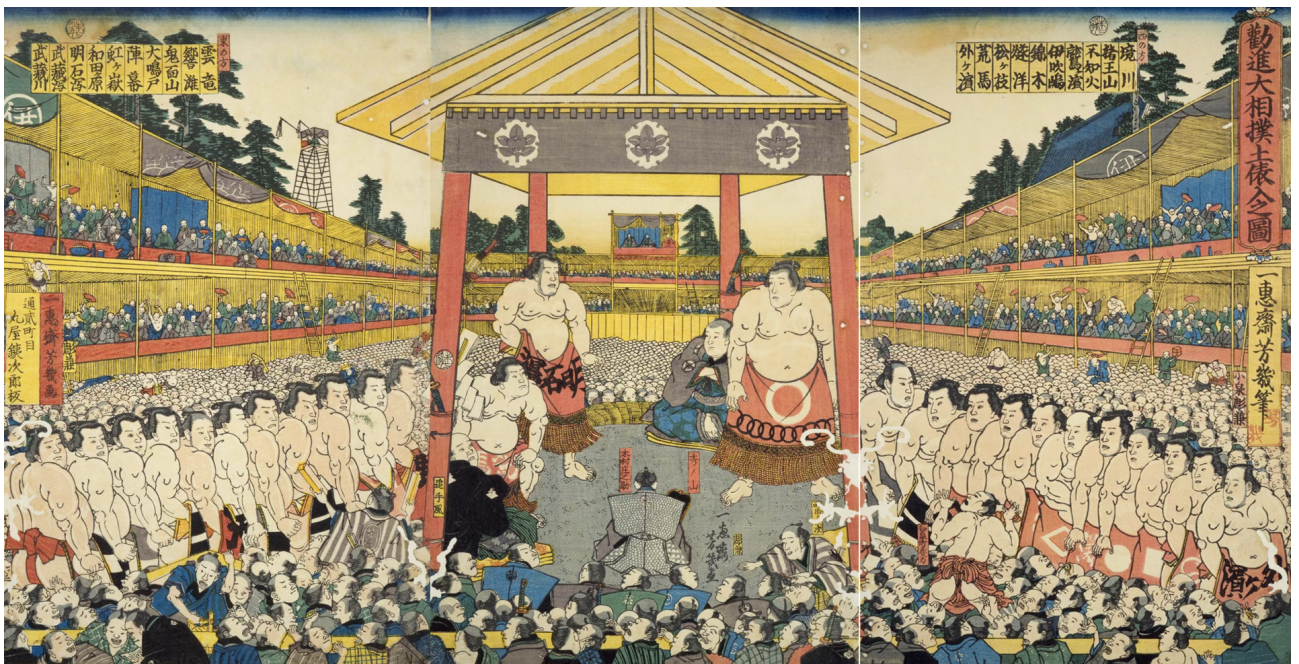
Figura 3. Interior de una arena de sumo en 1859. Obra de Utagawa Kunisida. En “Kanjin Zumō Dohyōiri no zu”, 1-3.

Otro contexto de espectáculos serán los combates de sumo. Los inicios de este ya quedan registrados durante las primeras fuentes japonesas (estas son, el Kojiki y el Nihon Shoki ), relacionados con los contextos religiosos, aunque durante el periodo Edo sufrió un cambio radical. Según el profesor R. Kenji Tierney, este cambio fue dado por la creciente urbanización en ciudades como Edo, Osaka o Kioto, además del aumento de la publicidad en relación con los combates. El sumo en su puro contexto de entretenimiento tuvo un gran auge con respecto a los periodos previos 58 . En relación con esta concepción del contexto del sumo como un espacio para socializar en vez de únicamente como deporte o función religiosa, se puede observar la obra de Utagawa Kunisida en 1859 (Figura 3). Esta representa el ambiente de un estadio de sumo durante la entrada