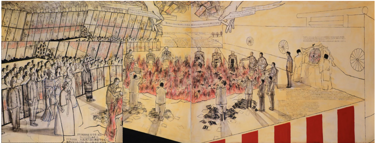
Figura 3. Plano general de la sección central de la obra donde salen dirigentes japoneses quemando libros; resaltado detalle con la representación de la continuación del espíritu de las “comfort women”. Tsuboi Akira, sección central de la obra “Un monstruo del Lejano Oriente reapareció aproximadamente 70 años después” ( Oyoso 70-nen-go ni futatabi arawareta Kyokutō no kaibutsu , 2020), conformada por dos paneles de madera (116,7 x 80,3 cm), cortesía del artista.

una formada por paneles de madera, que hacen referencia directa a Abe, al problema más general del revisionismo histórico en la actualidad (Akira Tsuboi Web, 2023) y al rumbo peligroso que puede llegar a tomar Japón. De esta manera, y siendo tema presente en toda su producción esta práctica del gobierno “to erase their misuse of power from history,” Tsuboi es reflejo del espíritu de querer crear una red de artistas transnacional en contra del revisionismo japonés (Lee, 2021) al mismo tiempo que aboga por presentar un arte más al alcance que pueda ayudar a introducir al público más general en estos procesos, debates y realidades.