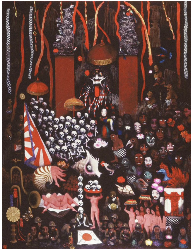
Figura 2. Uso de motivos del folclore panasiático y representación explícita de la violencia sobre las “comfort women”. Tomiyama Taeko, “La noche del Festival de Galungan” ( Garungan no matsuri no yoru , 1986), óleo sobre lienzo (162 x 130 cm), colección de la artista.

Priorizando y dándole fuerza a un discurso que enfrentaba la guerra en vez de evadirla , la intención del arte de Tomiyama es “reconciliadora” (Jennison, 2012: 301), centrada “en el recuerdo no como trauma sino que como una postura moral de empatía” (Hein, 2009: 14) y generando en el espectador complicadas reflexiones frente a una memoria oficial abiertamente negligente. Su obra, personal pero autocrítica, es el mejor ejemplo de reconocimiento del sufrimiento y uso de estética ‘asiática’ desvinculada de todo tipo de ideologías esencialistas a la vez que abraza la futura armonía en Asia, donde Japón haya reconocido, asimilado y reconvertido sus acciones durante la guerra en posibilidades de cura y reconciliación.