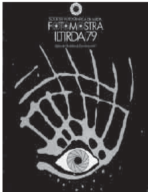
Portada del catàleg de la Fotomostra Iltirda/79, celebrada durant els mesos d'abril i maig del 1979.

premi, sinó únicament exhibició. En uns anys en què la pràctica fotogràfica amateur semblava únicament limitada a l'àmbit concursístic, s'obria amb la Foto-Muestra una nova via de difusió, lliure de qualsevol condicionament estètic. L'èxit de l'esdeveniment va animar els organitzadors a repetir l'experiència, i amb aquest fet es