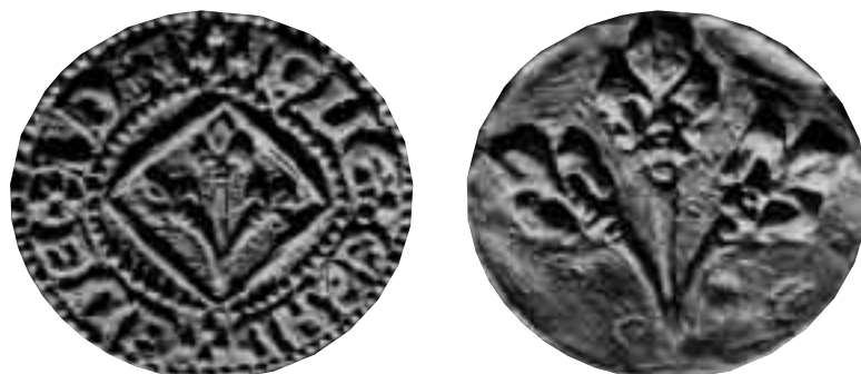
Reproducció de la moneda Pugeses, que constituïa el premi atorgat al concurs Ittirda.

començà a gestar una polèmica que després va dividir els mateixos membres de la Societat. No es tracta d'una polèmica aïllada, exclusiva de la Societat fotogràfica de Lleida, sinó de tot un moviment nacional de rebel·lió contra el fet concursístic. El cercle barcelonès, per exemple, integrat per fotògrafs com Joan Fontcuberta, David Balsells o Humberto Rivas, participava activament en la lluita contra el concurs, amb arguments que reclamaven una forma de creació fotogràfica més lliure.