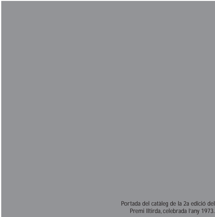
Portada del catàleg de la 2a edició del Premi Iltirda, celebrada l'any 1973.