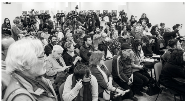
Presentació de l'obra de Santiago Sierra censurada a ARCO el passat 26 de febrer a la Fundació de Estudis Libertaris Anselmo Lorenzo (Madrid).

En cualquier caso, existen una serie de condiciones consensuadas por la Asamblea Parlamentaria del Consejo de Europa para identificar a un preso como político. Estas condiciones no solo hacen referencia a la violación de las garantías fundamentales establecidas en el Convenio Europeo de Derechos Humanos, como las libertades de pensamiento, expresión o asociación, sino que también registran los casos en que “la detención haya sido impuesta por razones puramente políticas”, o que “su duración o sus condiciones sean claramente desproporcionadas con respecto al delito que hubiese cometido” o “discriminatorias en comparación con otras personas”. Si hacemos un repaso de las personas incluidas en la pieza Presos políticos en la España contemporánea , que fue retirada de ARCO por un supuesto “desajuste conceptual”, nos daremos cuenta de que todas ellas cumplen con al menos uno de estos requisitos, incluso en aquellos casos