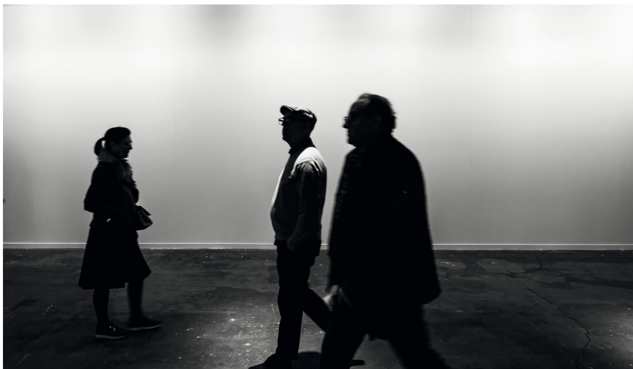
El mur blanc de l'estand d'Helga d'Alvear a la fira ARCO després de ser censurada l'obra de Santiago Sierra.

y justificable. Parte del supuesto de que el sistema que habitamos es por definición injusto, insolidario y desigual en sus oportunidades y en el trato que recibimos en función de nuestra posición social. A veces somos excesivamente generosos con las categorías establecidas y presumimos inmediatamente que vivimos en una democracia que no es,