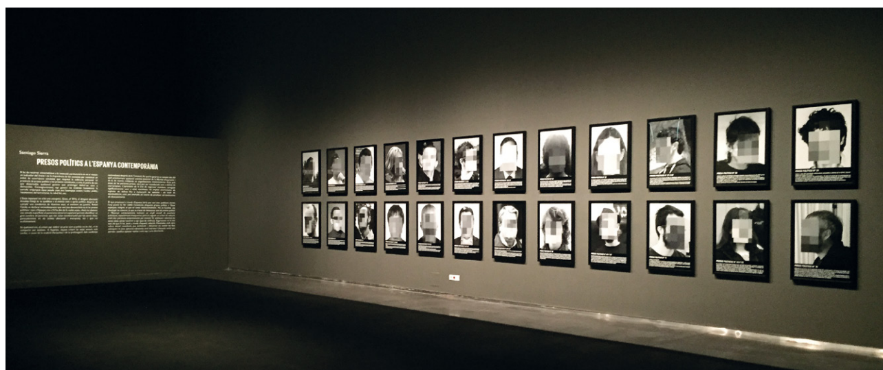
A dalt, Presos polítics a l'Espanya contemporània , durant la seva exhibició al CCCB (Barcelona). A sota, l'obra al Museu de Lleida.

cuando menos, imperfecta. O que el concepto de justicia se refiere a algún tipo de realidad etérea e incontaminada por la política o la economía, y que no hay nada interpretable en ella. O que las propias leyes obedecen a una necesidad objetiva de autodefensa de la sociedad antes que al mantenimiento de