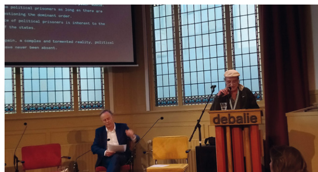
Santiago Sierra intervinent a la taula rodona rodona "Political Prisoners in Contemporary Spain". Forum on European Culture (De Balie, Amsterdam), 31 de maig de 2018.

Desde ese punto de vista, podría irse más allá: no solo todos los presos serían políticos, sino que todos seríamos virtualmente presos políticos: todos viviríamos reclusos en un sistema jerárquico, segregador y violento, expuestos a la dictadura de una ley ciega que penaliza el disenso con más fuerza que la traición a los intereses públicos o el abuso de poder, temerosos de contravenir con nuestras opiniones esta paz artificial. El propio recurso universal a la institución penitenciaria sería en sí mismo un indicador del fracaso y la impotencia de la sociedad para construir un ámbito de convivencia saludable que respete la soberanía personal.