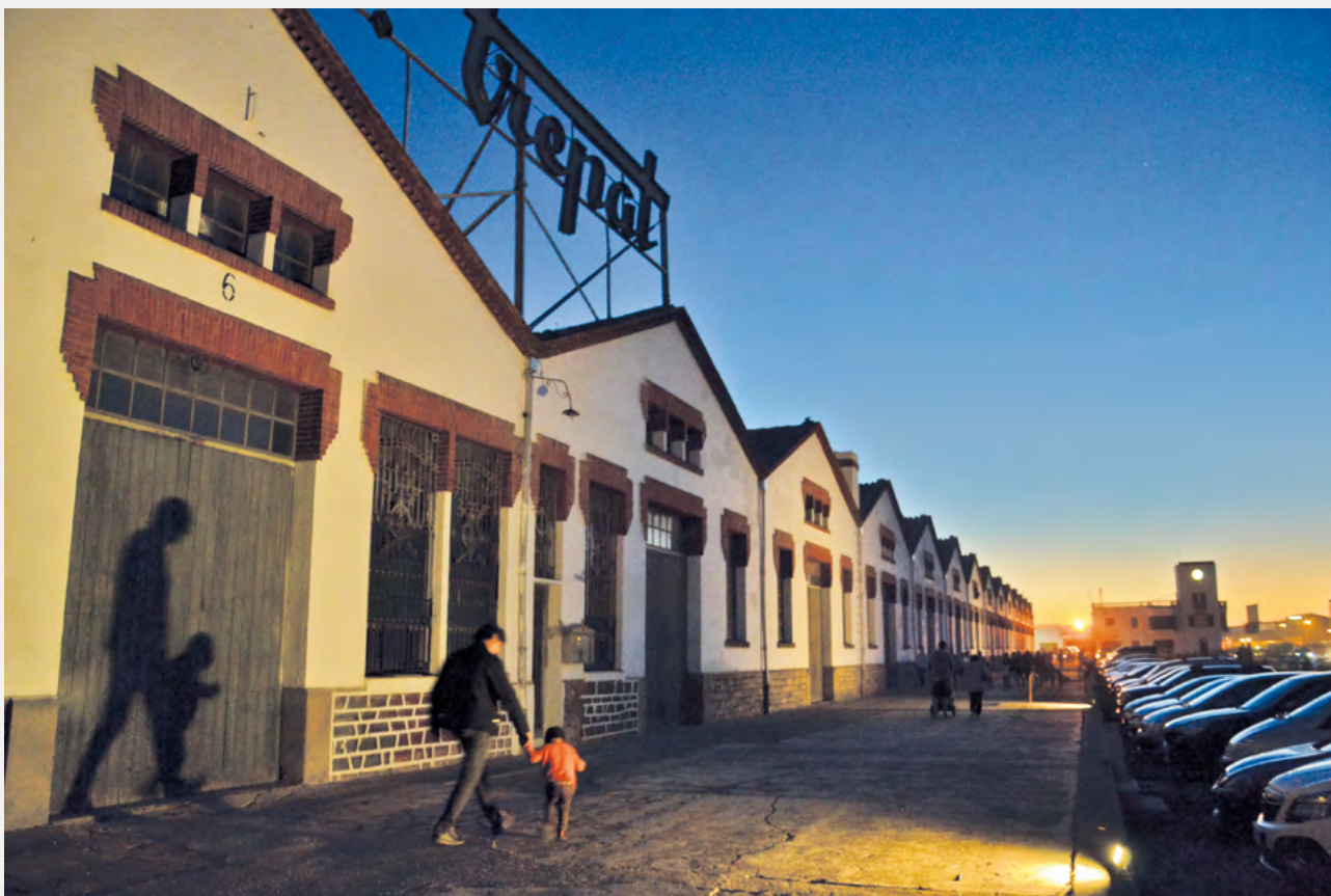
Mc Trepat. Museu Trepat.

introduir millores tècniques —com la impermeabilització de les teulades—, les quals, però, no van desdibuixar gens la construcció històrica. En la implementació del projecte museístic es va optar per una intervenció de micromuseografia, també en la línia de conservar l'ambient de la fàbrica en el decurs de la seva història (olors, colors i sensacions d'encetar un viatge en el túnel del temps).