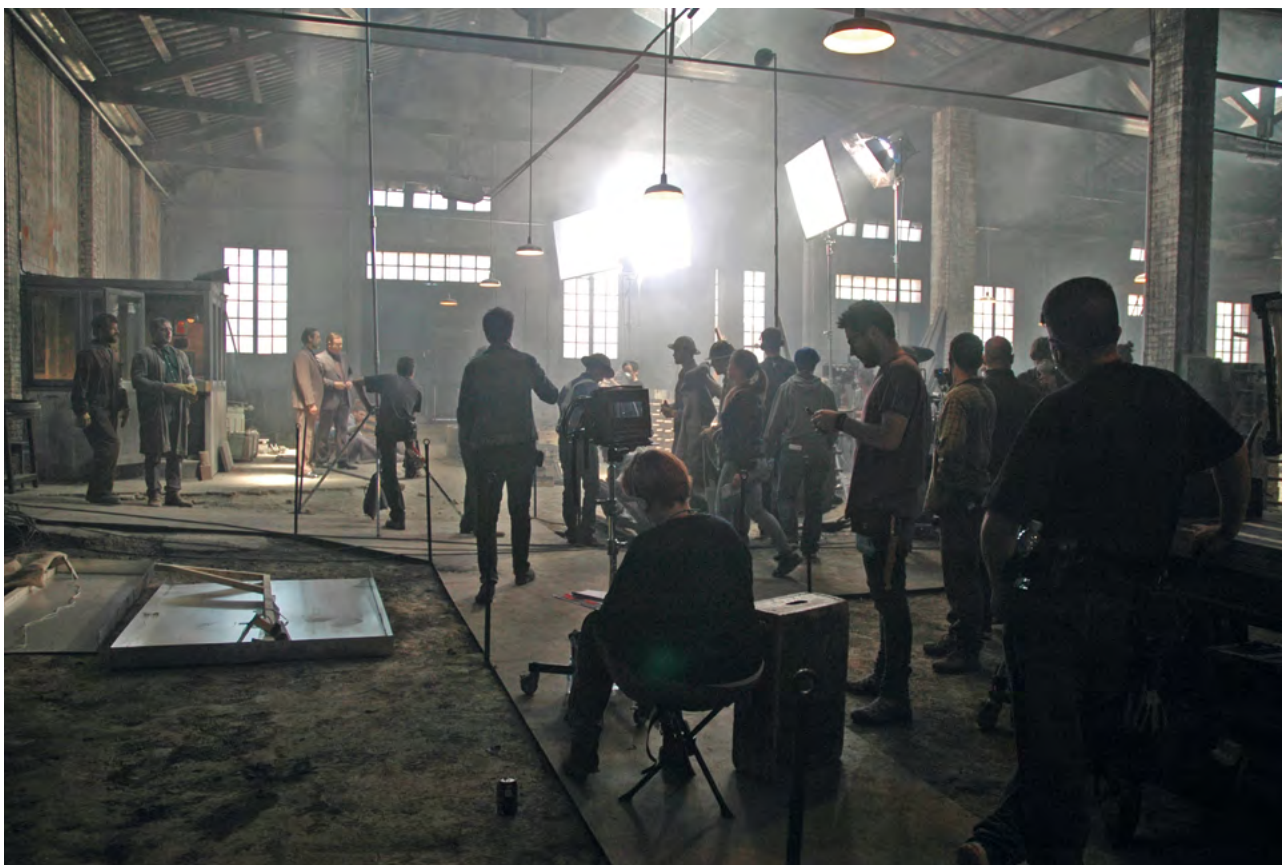
Rodatge de la pel·lícula Vulcania . Nau 4, Museu Trepat.

que la fàbrica Trepat va mantenir amb indústries dels Estats Units que produïen el mateix tipus de maquinària agrícola i que van ser pioneres.