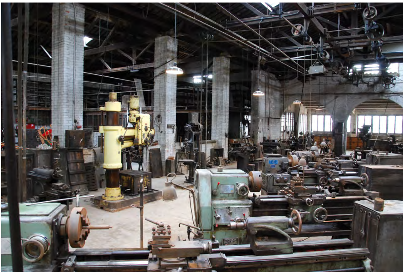
Embarat, sistema de politges i corretges, nau 5, Museu Trepat.

tarà el casal de Josep Trepat va preveure edificar, a finals dels anys cinquanta del segle XX, al costat del departament comercial de la fàbrica. En aquests espais s'ubicarà una residència per a la creativitat artística i un alberg per als pelegrins del Camí de Sant Jaume i es restaurarà mobiliari de Cal Trepat, i en els salons principals de la casa s'explicarà la història de Josep Trepat. Es preveu executar aquesta rehabilitació el 2021.