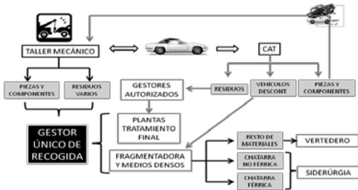
Figura 3. Esquema de la propuesta con los agentes implicados en la gestión de residuos del automóvil

Para la creación de una red es de gran interés el poder llegar a establecer lazos de colaboración con las principales asociaciones ya existentes, como por ejemplo SIGRAUTO que está constituida por los principales sectores involucrados en el tratamiento de los vehículos (ANFAC, ANIACAM, AEDRA Y FER), SERNAUTO, FACONAUTO y los principales gremios de talleres independientes del país.