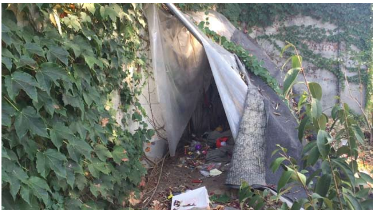
Fig. 11: Condizioni di degrado nei Giardini di Plastica

Sebbene la situazione di degrado e abbandono perduri fino ad oggi, tanto da indurre gli abitanti del quartiere di Sarzano a richiedere il sequestro dell’area con un esposto alla Procura della Repubblica (Fig. 11), da alcuni anni i Giardini di Plastica sono oggetto di un lento e difficoltoso progetto di riscatto e di