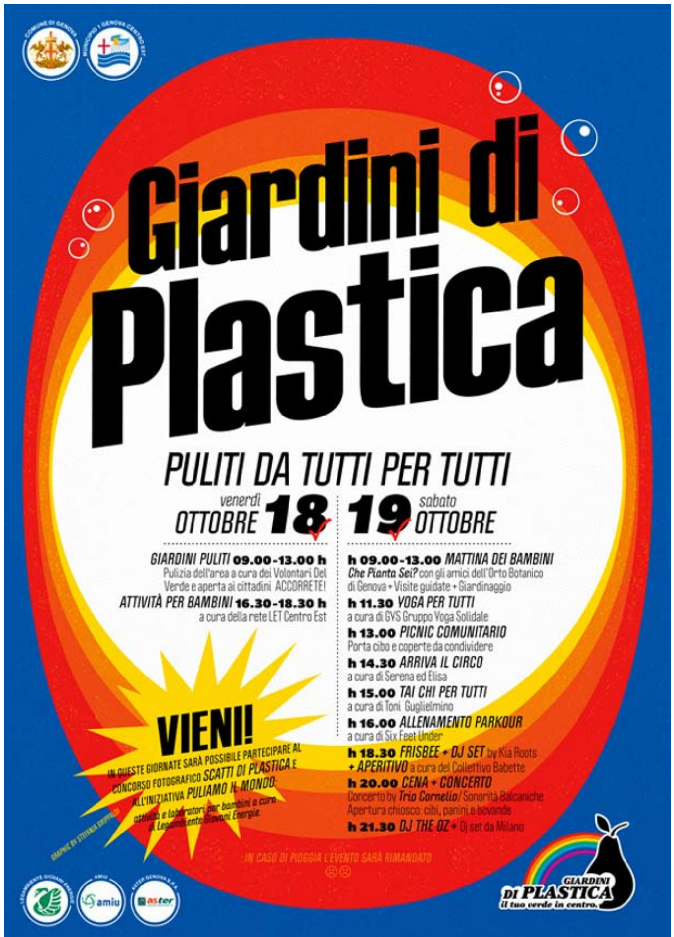
Fig. 13: Manifesto con cui l'Associazione Giardini di Plastica invita la cittadinanza a partecipare a due giornate di eventi organizzati ai Giardini Baltimora e a ripulire l'area dai rifiuti