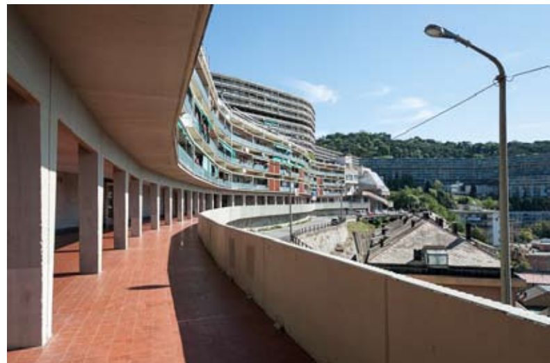
Figg. 8, 8a, 8b: Il “Biscione” – Quartiere INA-Casa di Forte Quezzi

essere undici) che si sviluppa senza soluzione di continuità per 540 metri di lunghezza; al terzo piano, una rue intérieure attraversa la struttura da parte a parte, formando una terrazza panoramica continua che, nelle intenzioni del progettista, avrebbe dovuto costituire una moderna promenade architeturale. Tale soluzione si ritrova nel “Blocco D”, anch’esso a sei piani, mentre i blocchi “B”, “C” ed “E” si elevano per soli tre piani. Anticipando quello che sarebbe stato il destino delle “Dighe”, delle “Lavatrici” e di tutti gli