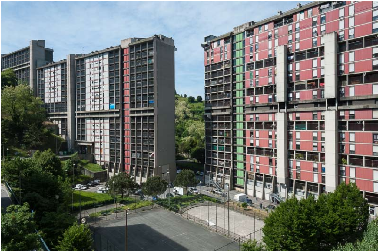
Figg. 4, 4a: La "Diga" – Quartiere Diamante a Begato