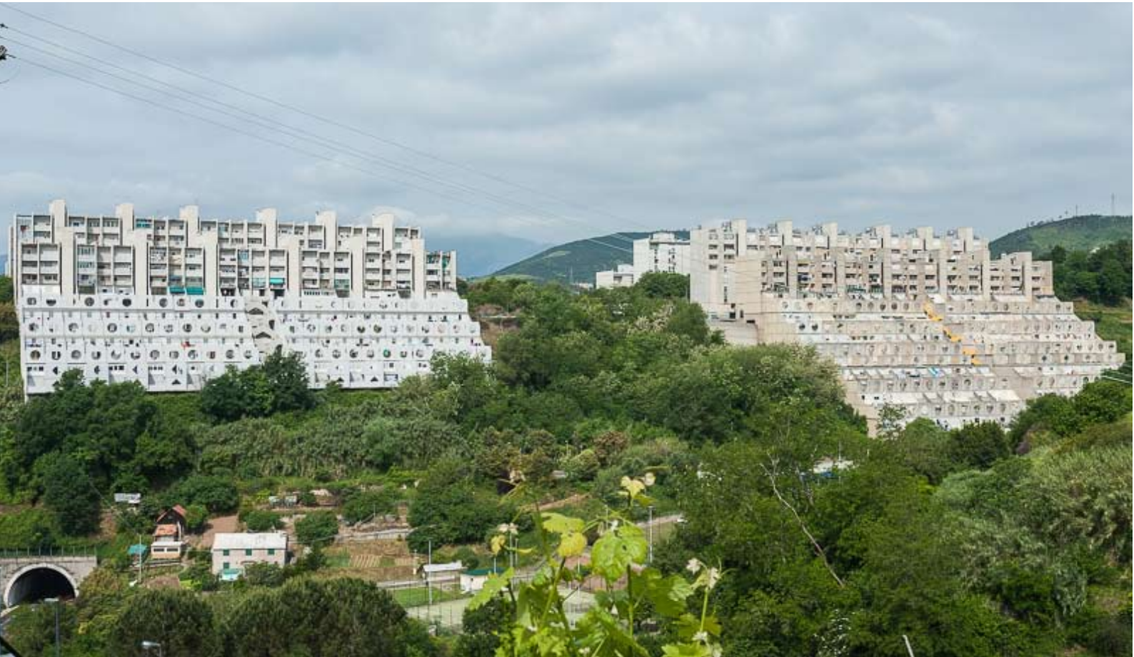
Figg. 5, 5a: Le "Lavatrici"– Quartiere San Pietro di Prà