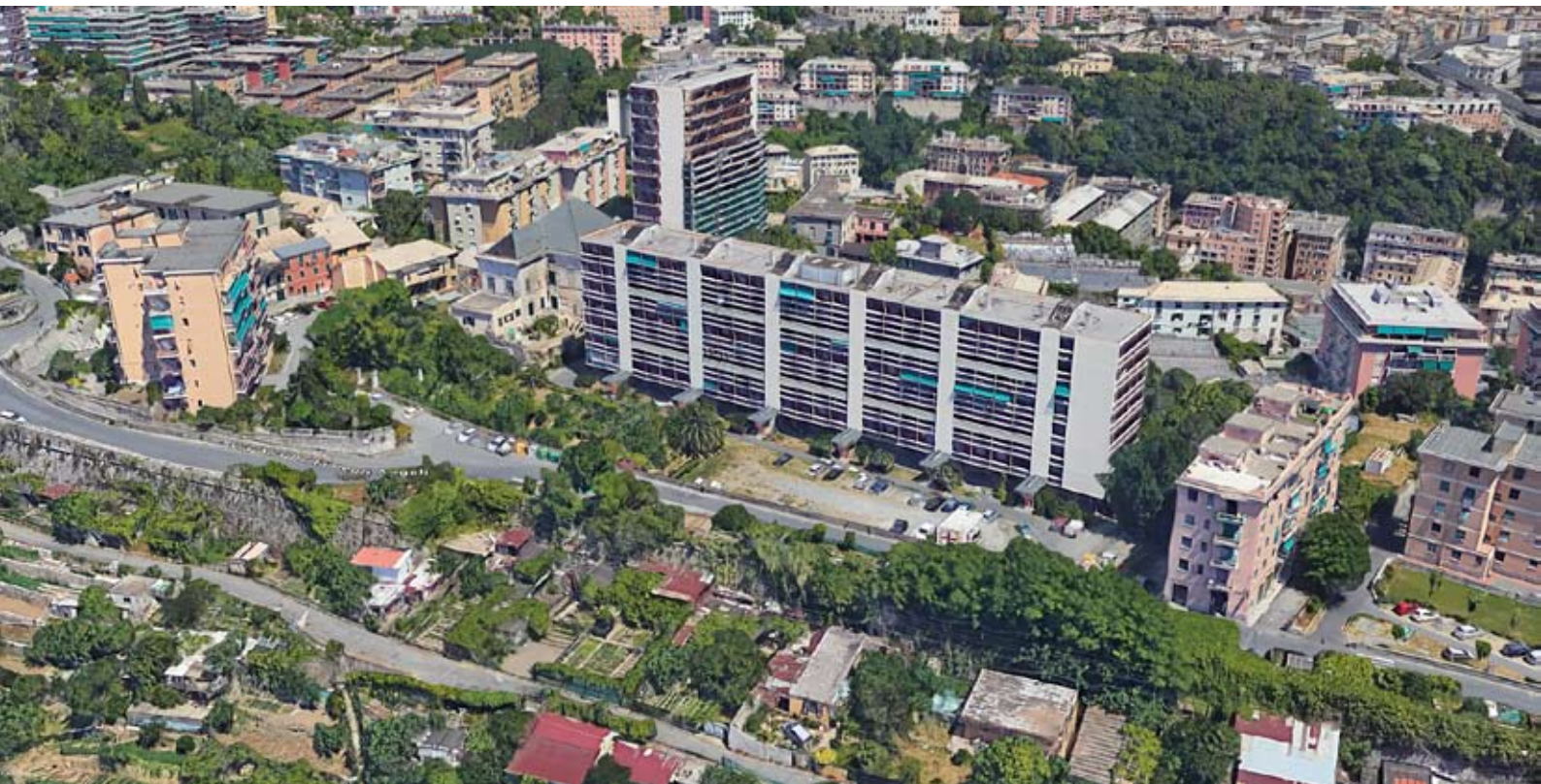
Fig. 7: Quartiere INA-Casa Mura degli Angeli.

Plan Obus di Le Corbusier per Algeri, Daneri guida un gruppo di trentacinque architetti e progettisti nella realizzazione di cinque lunghe case in linea che seguono a serpentina l'andamento delle curve di livello della collina su cui sorgono. La più estesa di esse è il "Blocco A" soprannominato il "Biscione", di cui Daneri cura personalmente la realizzazione: si tratta di un edificio a sei piani (originariamente avrebbero dovuto