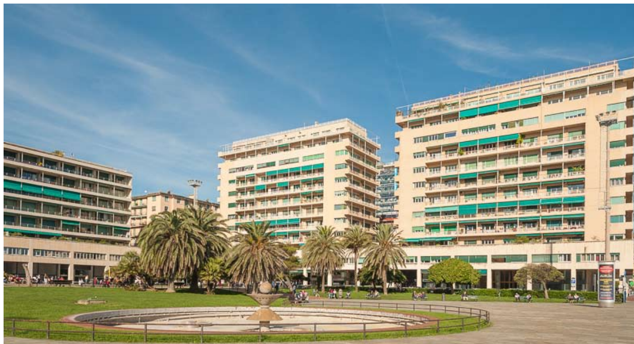
Fig. 9: Case Alte alla Foce, oggi Piazza Rossetti

declinano la lezione di Le Corbusier in rapporto alle esigenze abitative di cittadini abbienti e al contesto paesaggistico di corso Italia (la passeggiata a mare nel levante cittadino), di cui costituiscono l'estremità occidentale (Spigno, 2016). Seguendo il progetto originario, interrotto dalla guerra, alcune di esse si dispongono a U a formare una piazza – piazza Rossetti – il cui lato sud è aperto verso il mare ma, ormai, separato da esso da una arteria stradale a sei corsie che collega il levante al centro della città e da una distesa di cemento destinata a ospitare, a periodi alterni, i baracconi del luna-park, le auto in sosta dei visitatori della limitrofa area fieristica, le discariche a cielo aperto di tutto ciò che viene travolto dalle frequenti alluvioni che funestano la città, i tendoni e i caravan del circo. L'esclusiva "piazza sul mare" in pieno centro affaccia, dunque, su un terrain vague degno delle più desolate periferie extraurbane (Figg. 9, 9a).