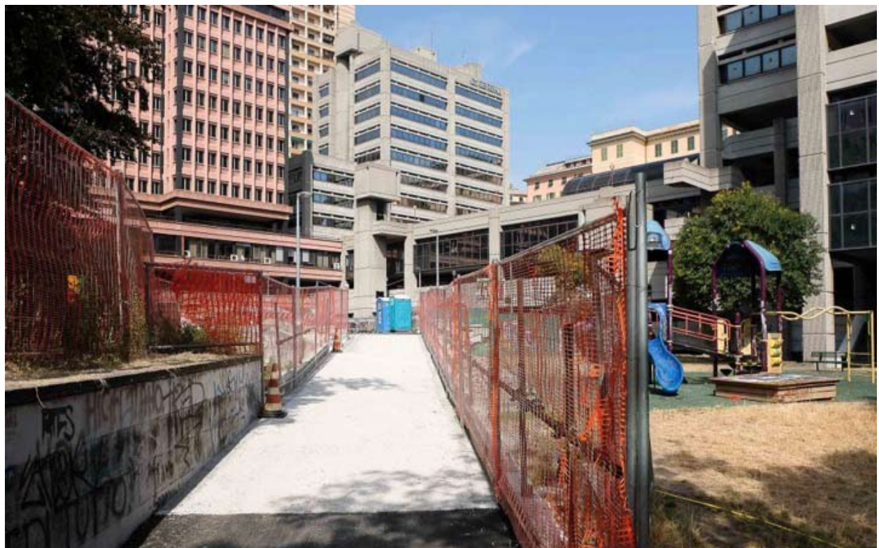
Figg. 10, 10a: Il centro direzionale di Regione Liguria e i Giardini di Plastica