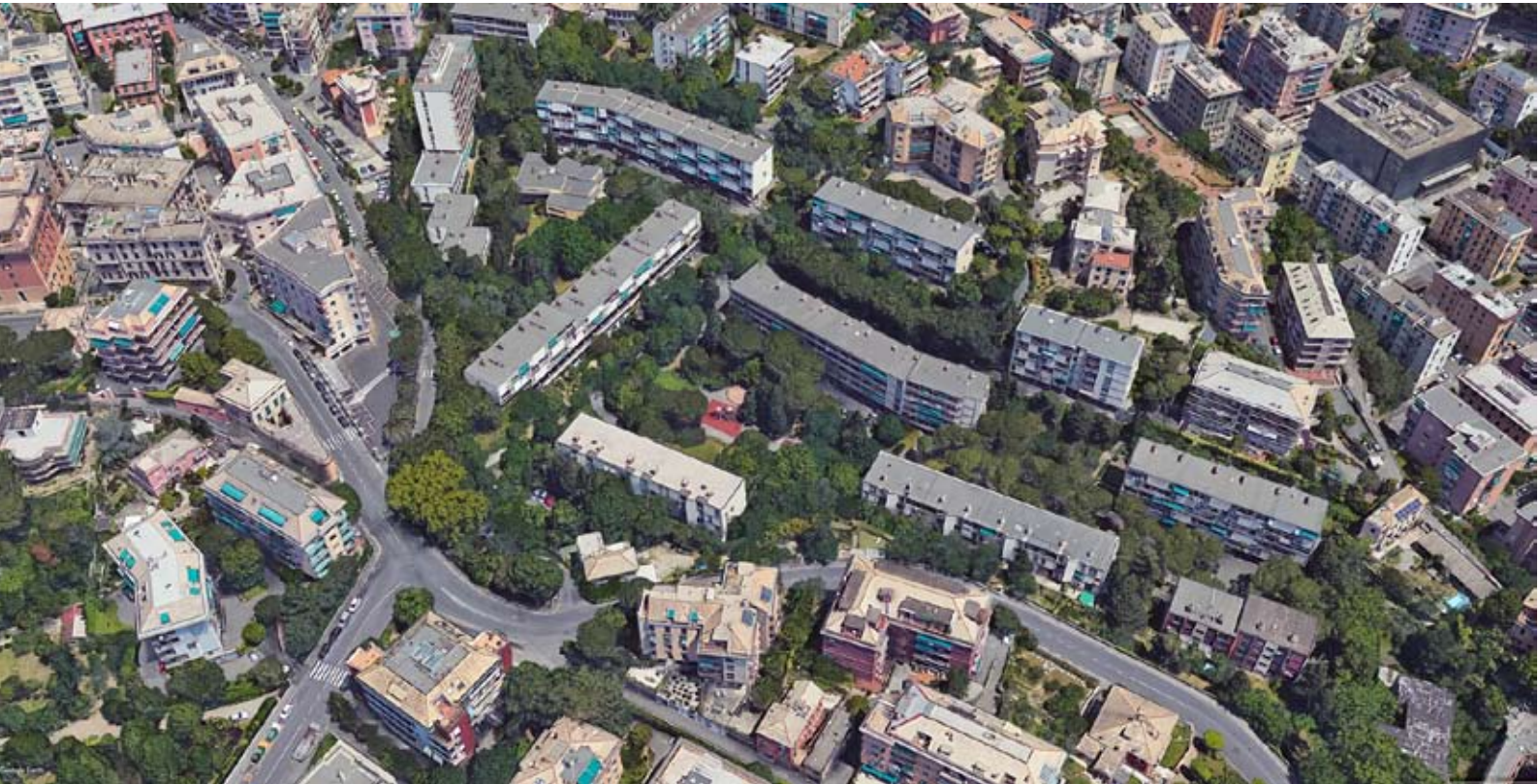
Fig. 6: Quartiere INA-Casa Bernabò Brea.