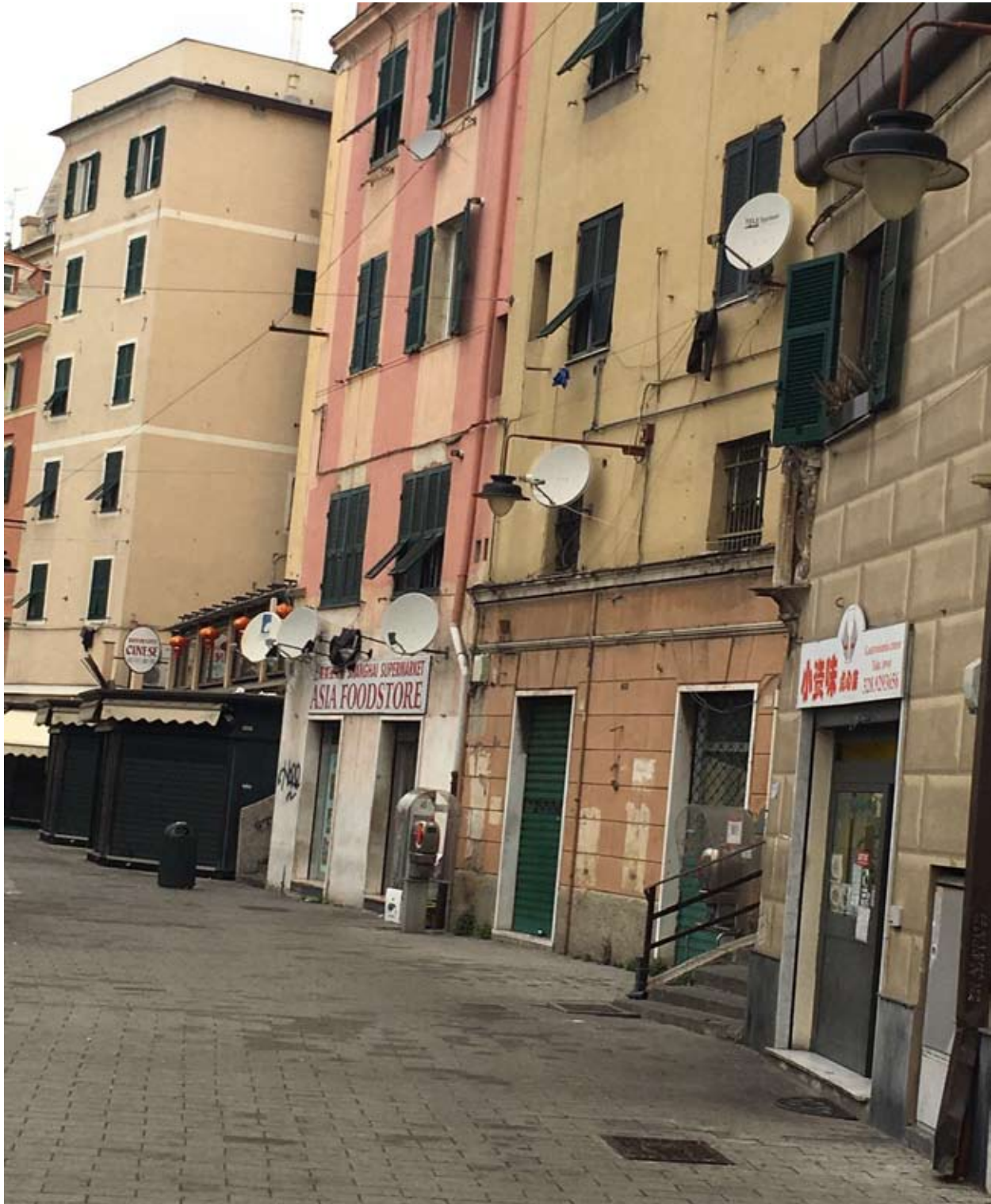
Fig. 14: Via Gramsci a Genova: Ethnoscape di fronte al Porto Antico

L'andamento assai variabile di queste mutazioni determina un instabile "policentrismo" anche all'interno di un territorio circoscritto quale è, appunto, quello della città antica: dal 1990 la zona di Sarzano, ai margini orientali del centro storico, ha conosciuto un processo definito dai più di "riqualificazione e rivalutazione" (ma, in realtà, di vera e propria gentrificazione) a seguito, in primis, al trasferimento della ex Facoltà di Architettura (recentemente entrata a far parte della nuova Scuola Politecnica) negli edifici appositamente progettati dagli architetti Ignazio Gardella, Giovanni V. Galliani e Luciano Grossi Bianchi (Boato, 2015) .