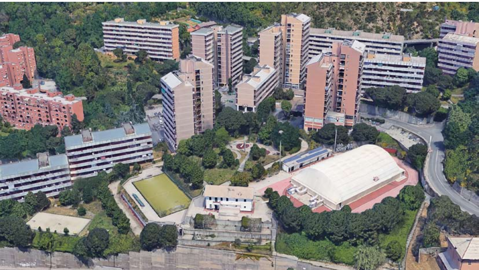
Fig. 3: Veduta del Cep con la struttura del PalaCep.

Petrillo (2016) riflette su come si sia così generata “una controtendenza importantissima rispetto ai processi canonici di etichettamento e di inferiorizzazione dei quartieri, quegli ‘effetti di luogo’ che si generano all’intersezione tra dimensione spaziale e sociale, e che producono con la loro azione una vera e propria squalifica sociale e una stigmatizzazione territoriale” 3