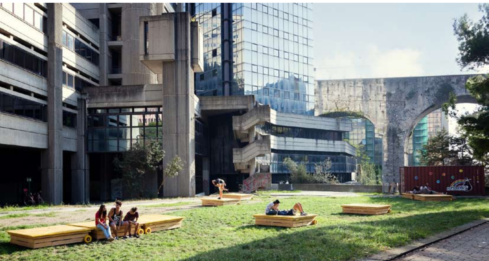
Fig. 12: I Giardini di Plastica “abitati” dai giovani dell'Associazione Giardini di Plastica

Ma la contraddizione forse più palese e spiazzante Genova la vive nel suo centro storico medioevale, tra i suoi celebri caruggi e le sue creuze, teatro di un costante ricambio della destinazione d'uso degli spazi (sempre più terziaria e legata, in particolare, alla promozione della cultura, del turismo e del tempo libero), delle attività produttive e, conseguentemente, degli abitanti.