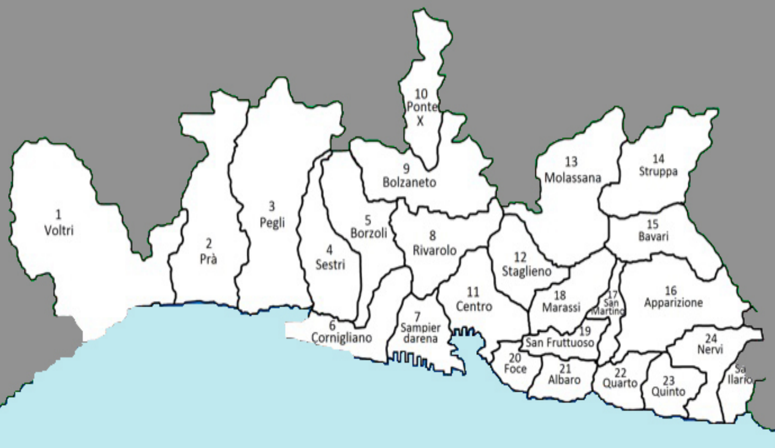
Fig. 1: Suddivisione schematica dell’area urbana di Genova nei suoi quartieri

In effetti, tanto per l’orografia del suo territorio quanto per le peculiari vicende della sua storia novecentesca, il capoluogo ligure presenta oggi caratteristiche che rendono estremamente difficile ragionare in termini di centro, di zone di espansione e di periferie.