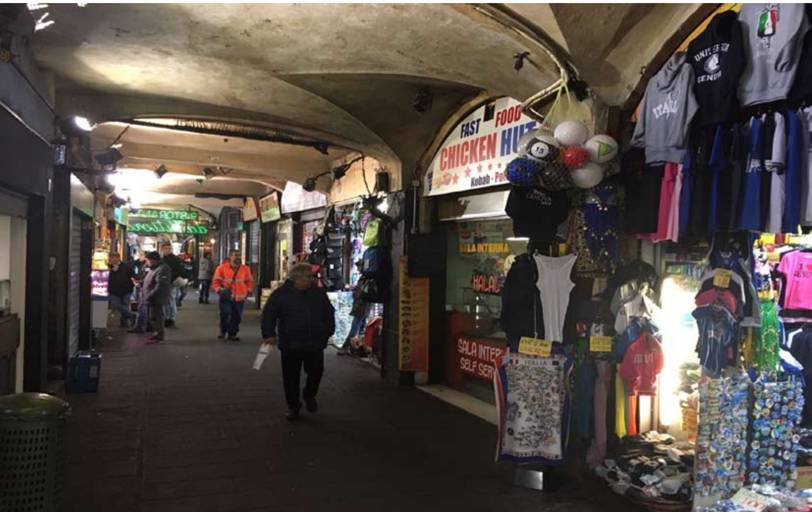
Fig. 15: Sottoripa a Genova: Ethnoscape di fronte al Porto Antico alla periferia. Non stupisce, pertanto, che il paesaggio oramai in gran parte gentrificato dei vicoli sia costellato di ethnoscares (Figg. 14, 15); al contrario, in un certo senso la loro presenza è di conforto per tutti coloro che ancora credono che l'identità multietnica della città sia uno dei valori culturali e patrimoniali più importanti da preservare.