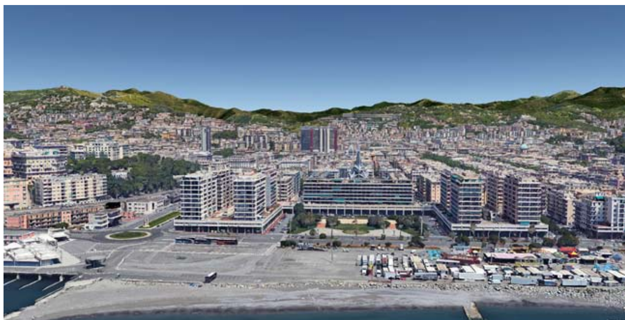
Fig. 9a: Veduta d'insieme del terrain vague che separa dal mare le "Case Alte alla Foce" di piazza Rossetti e il "Biscione" sulla sommità della collina.