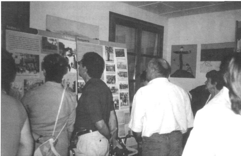
Exposició Lluís Companys i la seva època (confeccionada per la Coordinadora de Centres d'Estudis de Parla Catalana) al Masroig. Juny de 2005.