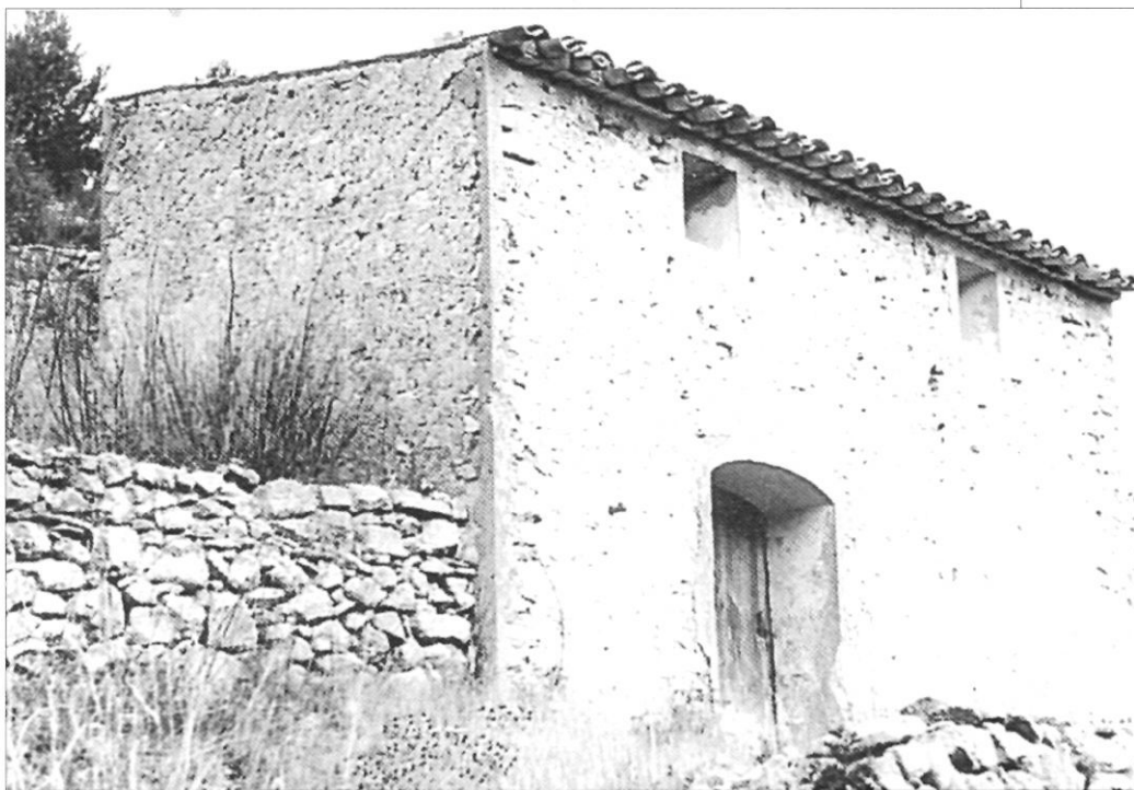
El maset del Llebreta a les Damunt Roques.

S'hi esmorzava al matí, s'hi feien les deu hores, i també a diari el tupí o la cassoleta, on no hi mancaven mai uns grans d'all, un fulla de julivert i unes esca-