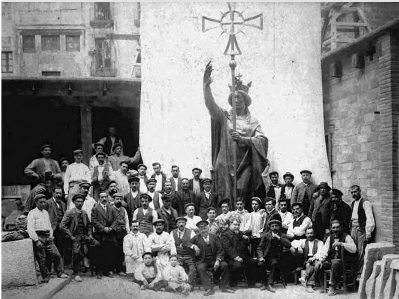
Eduard i la Santa Helena que corona el cimbori de la catedral de Barcelona