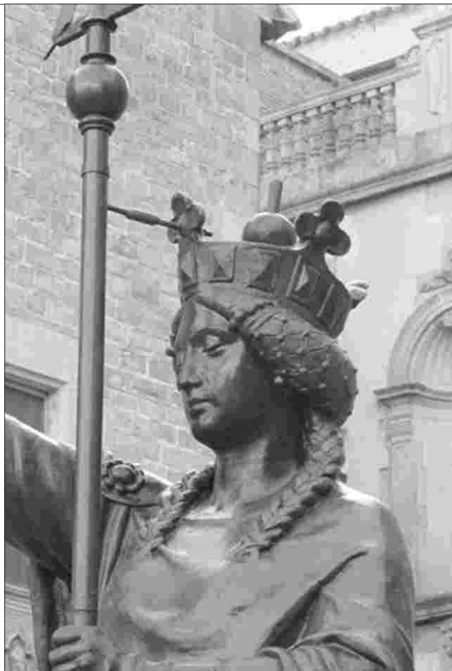
La mateixa Santa Helena restaurada un segle després (detall).

Tinc el privilegi de publicar, per primera vegada, una de les dues fotografies (de les ja citades talles de marbre del Museu Martorell) dedicades per Eduard a Manuel Girona, Comissari Regi de la Comissaria de l'Exposició Universal: l'industrial, banquer, alcalde, senador i president de la Càmera de Comerç Manuel Girona i Agrafel, Baró d'Eramprunyà (1818-1905) va agafar la iniciativa per tal de realitzar i finançar una nova façana principal de la catedral de Barcelona, continuant els seus fills el projecte després de la seva defunció. Potser una de les obres més emblemàtiques -i, indubtablement, una de les més belles- de Batiste