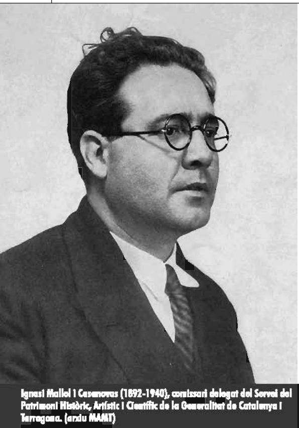
Ignasi Mallol i Casanovas (1892-1940), comissari delegat del Servei del Patrimoni Històric, Artístic i Científic de la Generalitat de Catalunya i Tarragona.