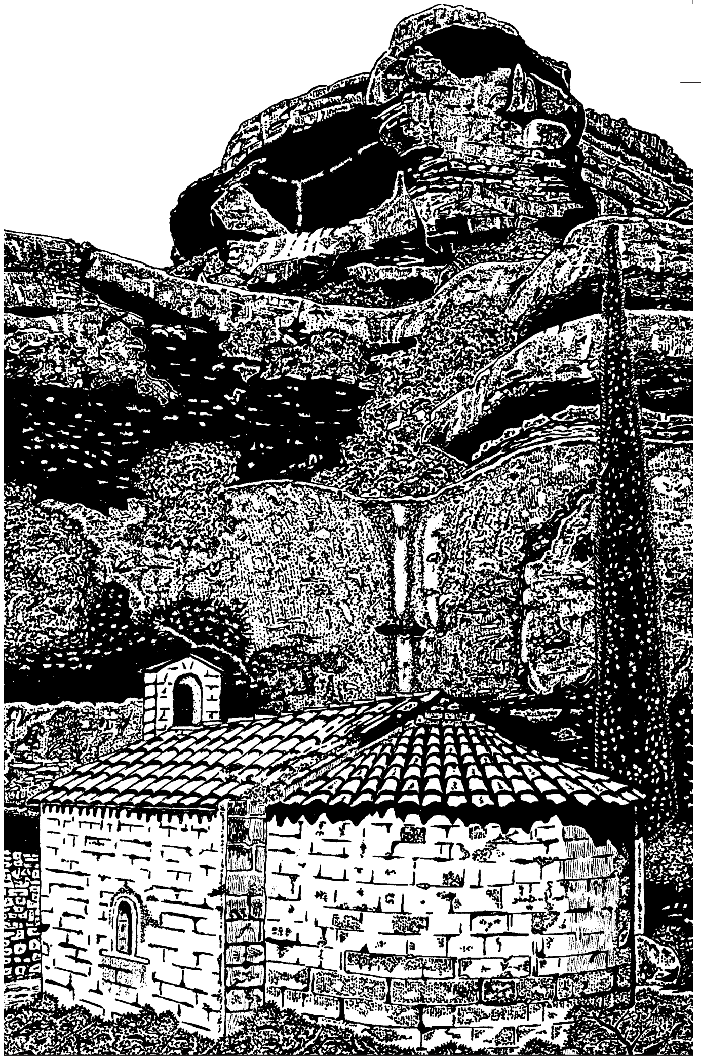
Sant Bartomeu. Montsant 2007