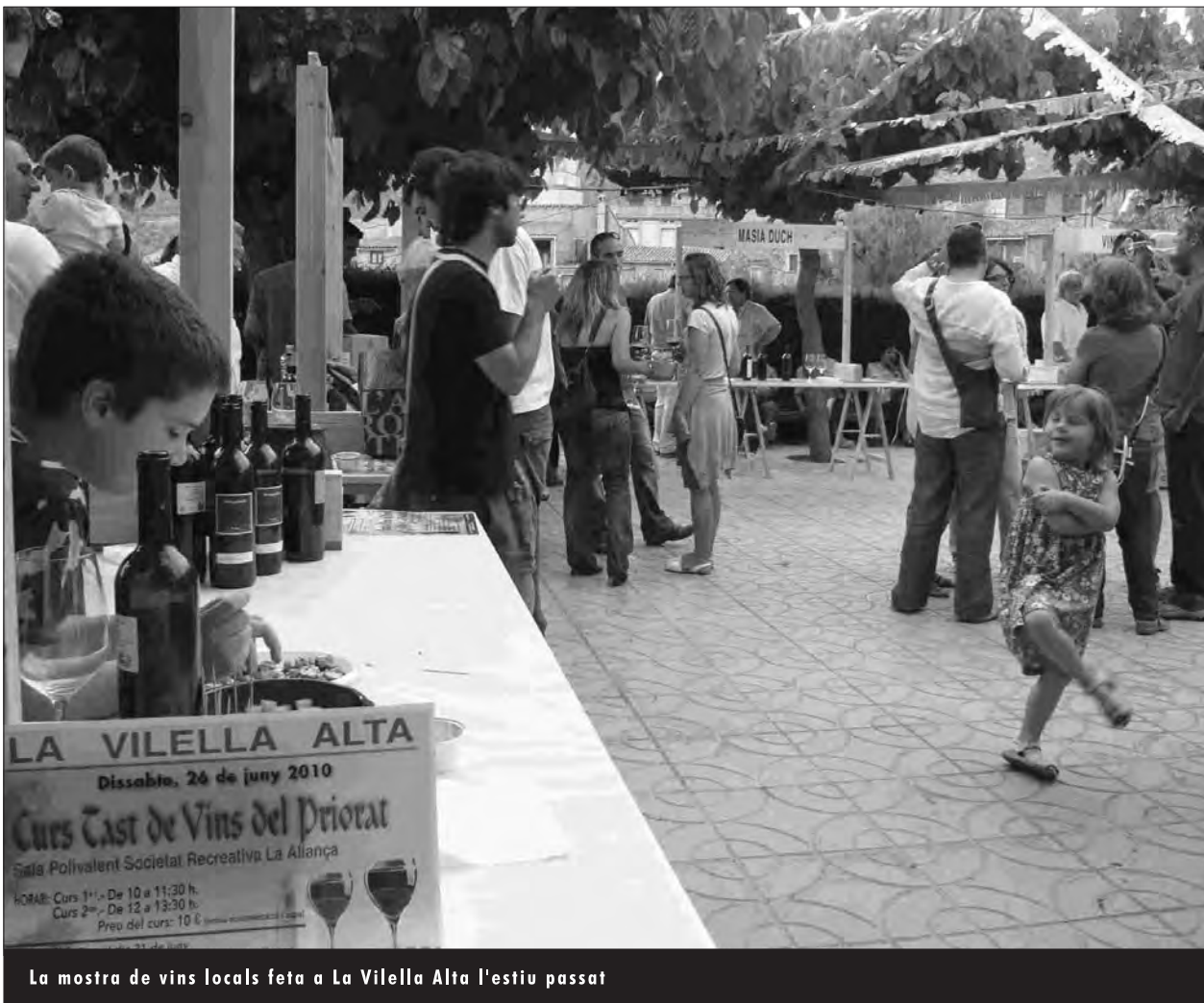
La mostra de vins locals feta a La Vilella Alta l'estiu passat

dia vam establir per als vins de finca: reconèixer formalment la procedència d'uns raïms, d'un vi que és originari d'un indret determinat (com se sap, la DOQ Priorat té el reconeixement del primer vi de finca de l'Estat espanyol). Això es traduirà en el fet que a les etiquetes d'una ampolla de Priorat hi podem trobar l'expressió "Vi de Vila" després del nom del poble d'on vingui el raïm amb què s'hagi elaborat aquell vi. El Consell Regulador de la DOQ Priorat establirà uns mecanismes de control que garantiran, doncs, la procedència del raïm, tal i com s'ha fet en el cas del vi de finca.