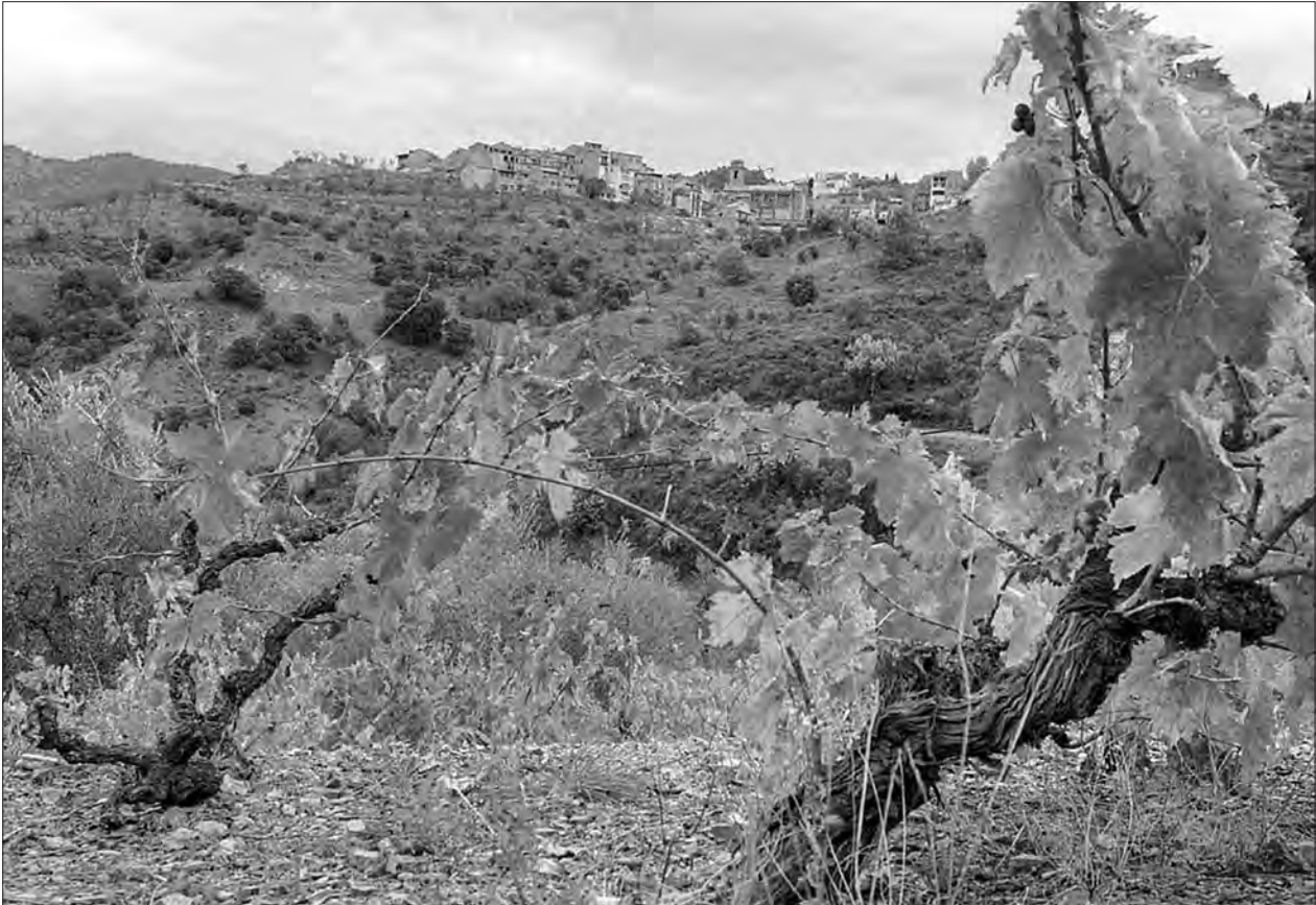
Un paisatge de la DOQ Priorat

la Nit dels Vins de Torroja (21 d'agost), la Festa del Vi i la Verema a l'Antiga de Poboleda (4 de setembre), la Festa de la Verema de Torroja (a l'octubre), el Tasta Porrera (novembre) i la Mostra de Vins de la Morera i Escaladei. A més, com sempre,