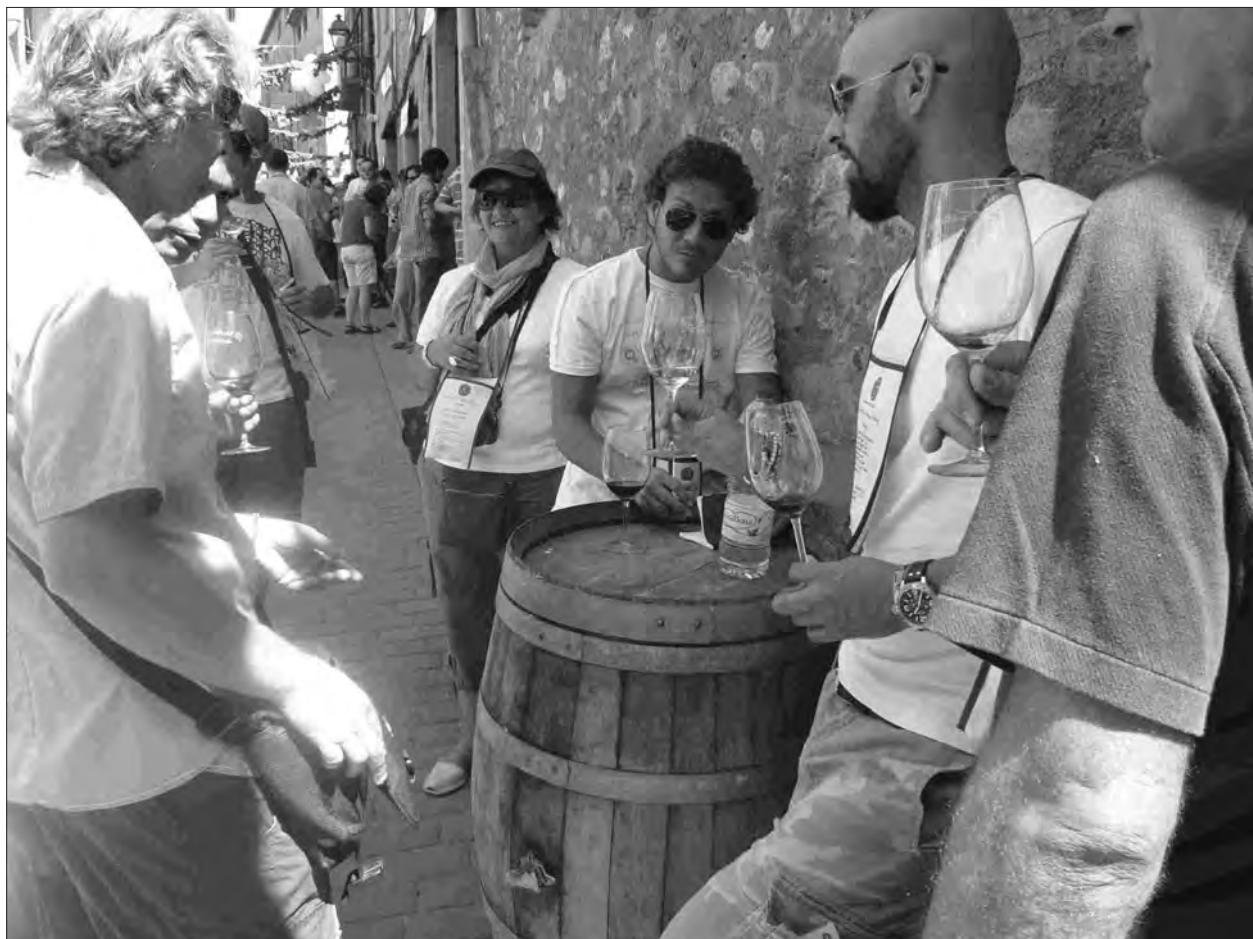
Un moment de l'última edició de la Festa del Vi i la Verema a l'Antiga de Poboleda

als nostres vins. El territori vitícola de la DOQ Priorat es troba ubicat als vessants pissarrosos que s'estenen al sud de la serra de Montsant i que configuren un amfiteatre natural obert al riu Ebre. Tot plegat, una superfície d'unes 20.000 hectàrees, de les