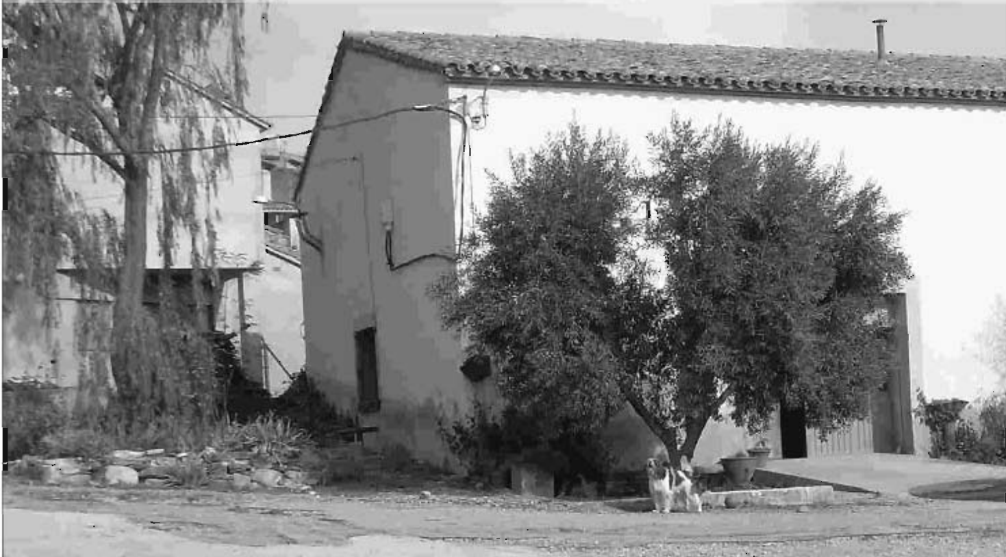
Edifici on anteriorment havia estat el molí d'oli.

[TEXT I FOTOGRAFIES] Carles Fogàs Puig i Jaume Teixidó Montolà