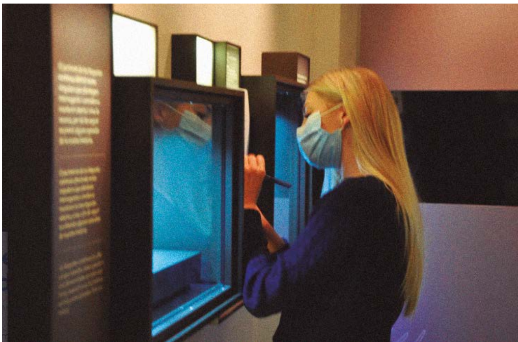
Exposició: Tragèdia al call, Tàrrrega 1348. Museu Tàrrrega Urgell

Per tant, les pràctiques d'art d'accés funcionen principalment mitjançant experiments d'assaig i error: un mecanisme que concorda amb l'èmfasi del pragmatisme en l'experimentació, que destaca la importància de les implicacions pràctiques de cada afirmació, un principi molt present en l'estètica de John Dewey i la idea de Maxine Greene d'imaginació social i educació estètica. Finalment, les arts de l'accés parteixen d'un enfocament inter-