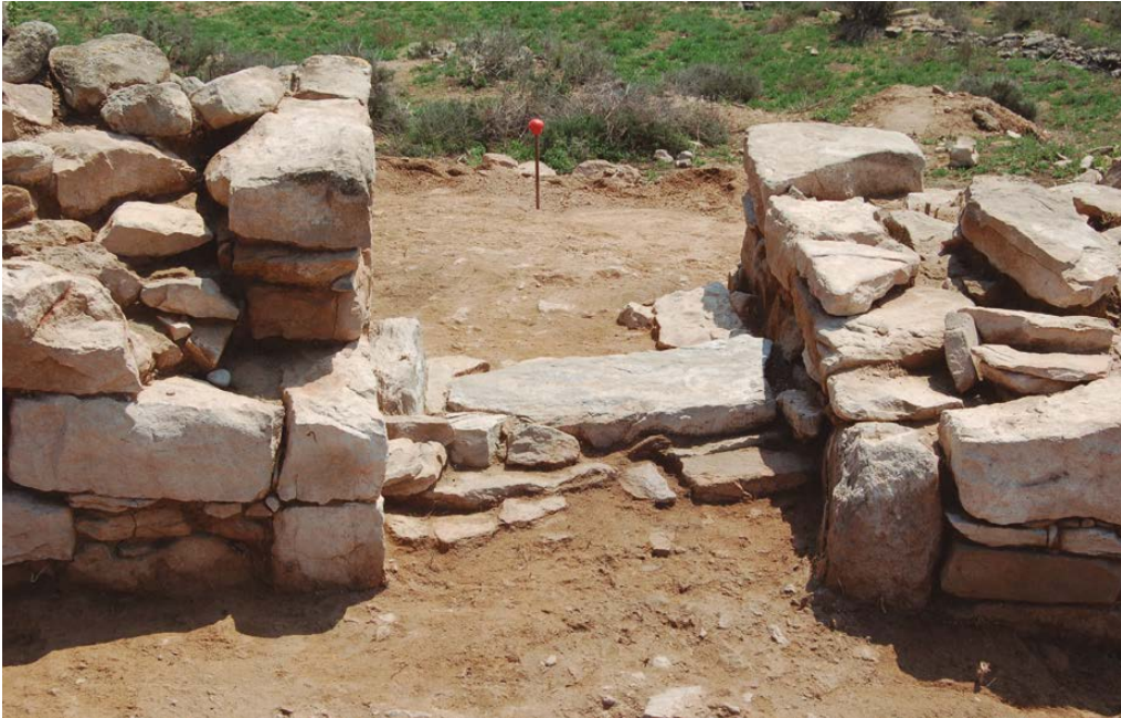
Figura 3. Porta d'accés al jaciment.

l'allunyen de la muralla a l'ús i que ha fet que es parlés més de mur de tanca que de muralla pròpiament dita.