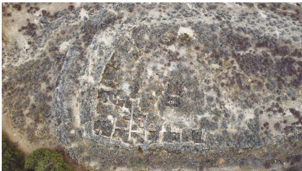
Figura 5. Vista actual del Tossal del Moro.

La tercera àrea d'habitació es localitza en l'extrem occidental de la plaça central. Fins al moment només s'hi ha documentat una casa i desconeixem, per falta d'excavació, si es tracta d'una habitació isolada o si forma part d'una bateria que s'estendrà cap a l'oest. Aquesta habitació es troba entre els dos carrers que surten de l'espai central, amb l'obertura de la porta al carrer meridional. Formalment, es basteix amb les mateixes tècniques que les anteriors i s'articula com una casa tripartida.