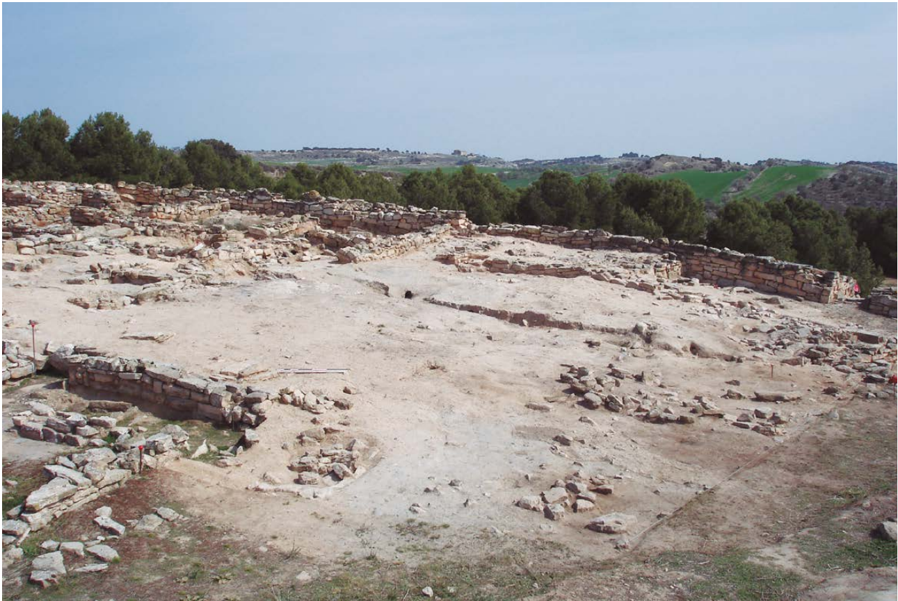
Figura 4. Vista general de la plaça del jaciment.

ves de gran gramatge. Tot i que podem arribar a considerar aquesta elevació com a tàpia, no es tracta de la tàpia canònica en tant que no s'han trobat les empremtes de les tapieres. La manca de teuleria en el registre ceràmic ens porta a pensar que els cobriments de les habitacions es feia amb material perible i terra. Tampoc existeix cap mena d'evidència de l'existència de pisos superiors o altells.