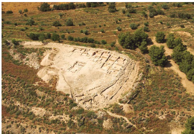
Figura 1. Vista general del Tossal del Moro després de la primera obertura en extensió.

Encimbellat en un tossal allargassat entre les serres d'Agramunt i d'Almenara, es troba el Tossal del Moro, un jaciment de cronologia visigoda situat a la partió entre els termes municipals de Castellserà i Agramunt i que és l'objecte d'aquest dossier (figura 1). Abans de les actuacions arqueològiques de què va ser objecte, el jaciment era desconegut en la bibliografia de referència fins al 1976, quan Ramon Boleda l'introdueix a la Carta arqueològica de les valls dels rius Corb, Ondara i Sió però sense donar-ne una ubicació exacta. Posteriorment s'inclouria a la Carta arqueològica de l'Urgell . El 1991 Josep Maria Puche hi fa referència al parlar de la necròpolis d'Almenara i li atorga una cronologia del segle VIII aC. Posteriorment, el 1993, publica un article a la revista Urtx titulat «La necròpolis d'Almenara i el seu entorn: una revisió cronològico-cultural», on comenta que tant la necròpolis com el tossal podrien ser contemporanis (PUCHE i SORRIBES, 1993).