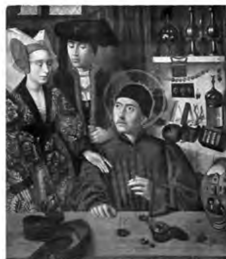
La leyenda de San Eloy y Godeberga. Autor: Petrus Christus. Existente en Lhermanns Collection. Nueva York