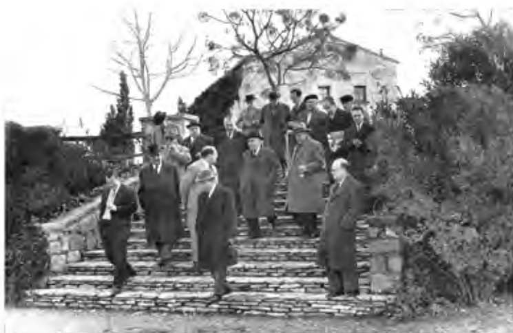
Visita a la Ermita de San Eloy por la Junta Directiva de la Mutua Metalúrgica de Seguros. Publicado en la revista DESTINO del 1.º de Septiembre de 1962.

(1962, imatges extretes del fulletó La Ermita de San Eloy y su sierra . Fons Associació d'Amics de l'arbre, Arxiu comarcal de l'Urgell, UI 0016)