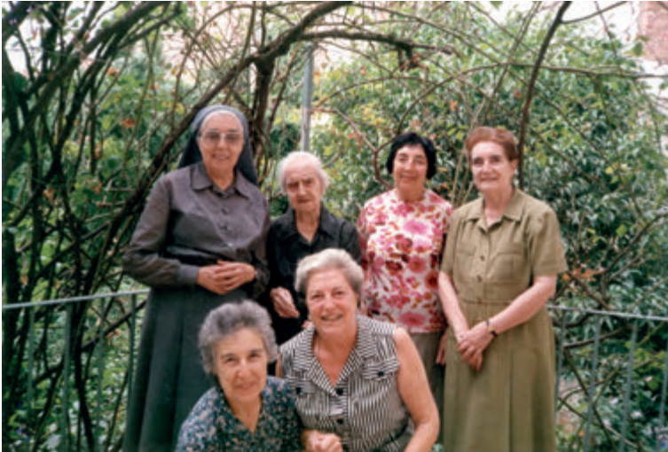
Retrat de la Vídua de Segarra (anys 50). Del FPFTS.

«Ya citado esposo que por tanto ha de ser el encargo de continuar el patrimonio y tradiciones de la casa Segarra y en prueba del mucho respeto que tengo al buen nombre de la misma dispongo que sean a favor de tal hijo o hija que sea heredero de mi referido esposo todas la joyas que tengo de mi noviazgo, o sea, como obsequio de boda y procedentes de regalos que él me hizo y que son, según me acuerdo, unos pendientes de oro con brillantes de gran tamaño, una polsera también de oro, un seudantí de oro y también con brillantes, una sortija igualmente de brillantes, que viendo que en cuanto a las demás joyas que existan de mis pertenencias seran repartidas entre los demás hijos que existieren en mi muerte». 23