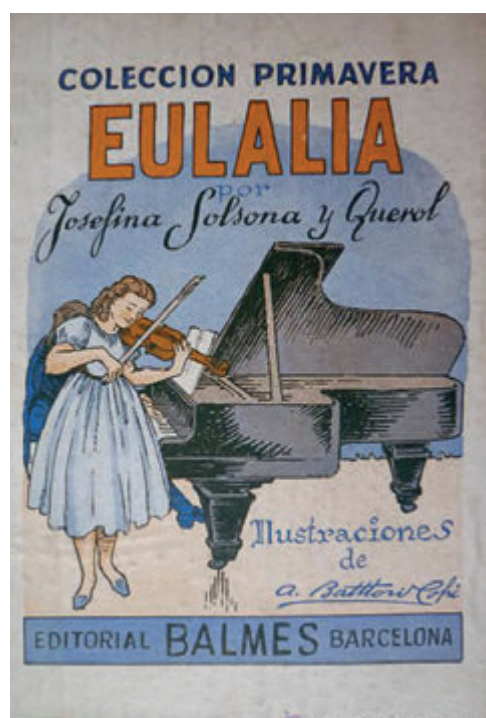
Portada Eulalia. Any 1950