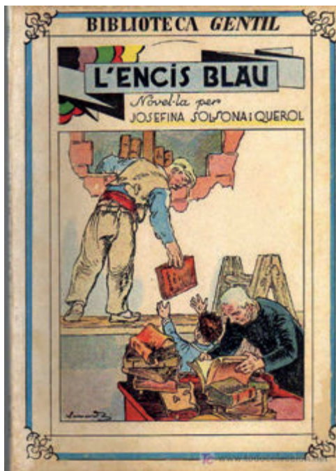
Portada de L'encís blau, any 1933.