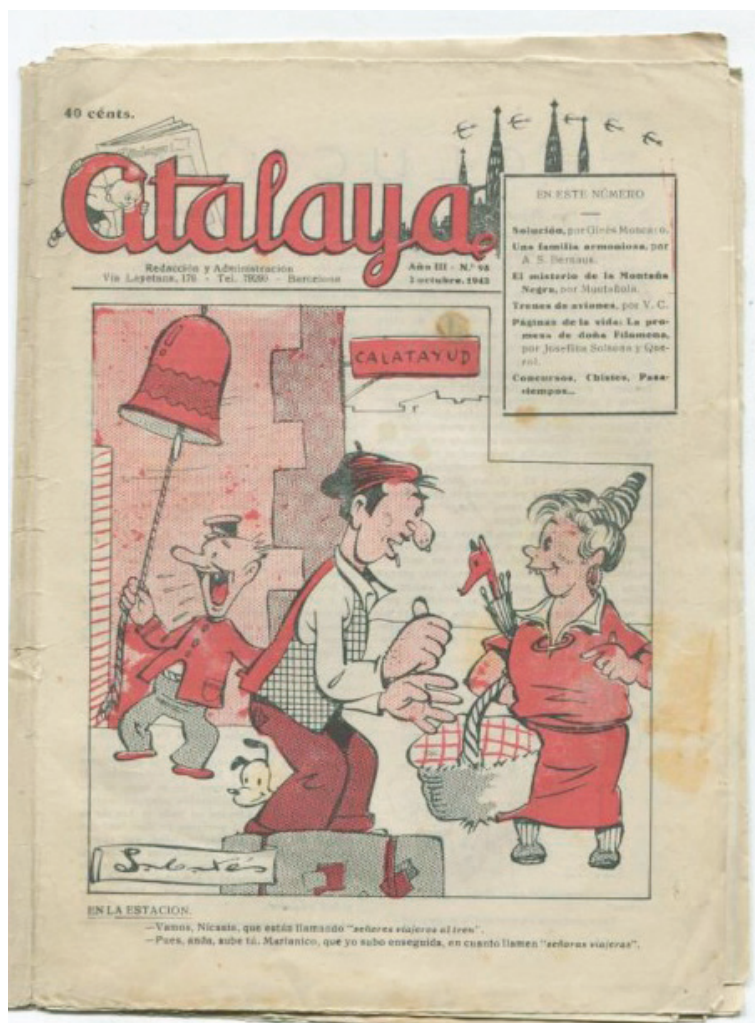
Portada revista Atalaya, any 1943.