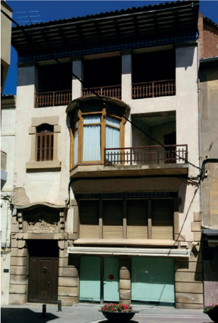
Casa Segarra, carrer del Carme, núm. 29. Imatge treta de la plana web https://latartraneta.wordpress.com/2016/04/24/la-casa-segarra-de-tarrega/

l'engròs fundat a Tàrrega pel seu avi. El local ocupava un espai entre els carrers del Carme i d'Agoders: