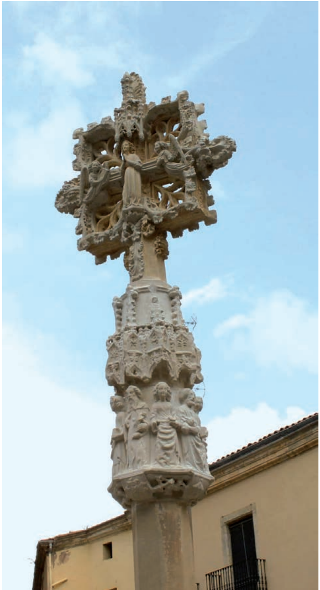
Figura 20. Magolla replicada i muntada.