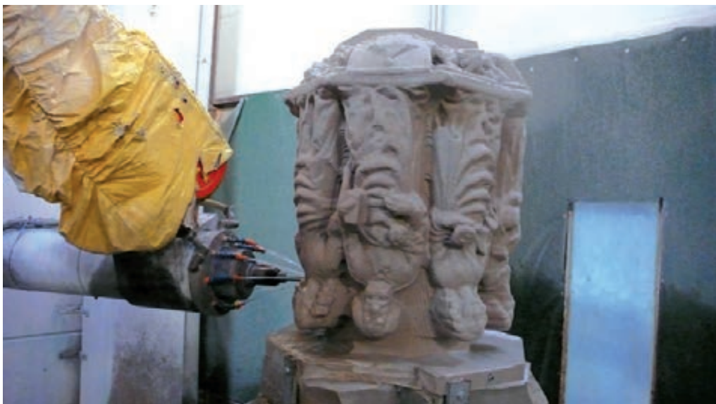
Figura 7. Procés de mecanitzat.

El procés de treball del robot s'assembla molt al procediment tradicional emprat pels escultors. En un primer pas, es procedeix a l'escalabornat de la peça, és a dir, a buidar el màxim de material possible per aproximar-se a la forma. En aquest pas, el robot empra una fresa 6 cilíndrica de molt calibre, que fa treballar fent passades i desbastant material. En un segon pas, es procedeix a aproximar la peça amb més definició, per a la qual cosa el robot canvia la fresa més gran per una de mitjana, i, finalment, es procedeix al treball de modelatge i aproximació màxima a la forma amb una fresa cònica en punta d'1 mm de secció.