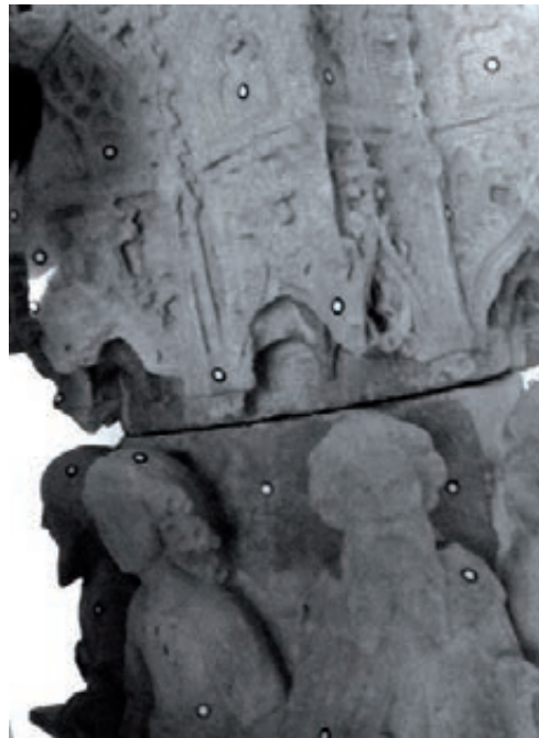
Figura 4. Marques utilitzades per a la unió dels diferents escanejats.

Sobre la peça a mesurar, se situen marques adhesives circulars que s'utilitzen com a re-