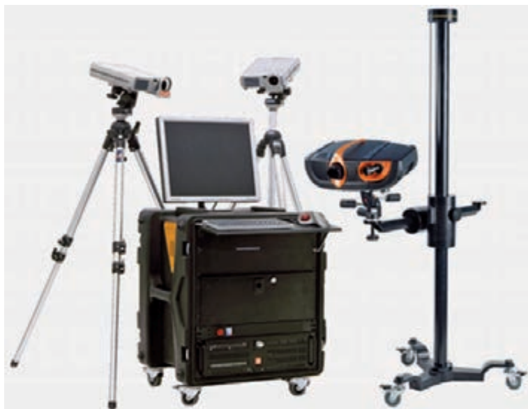
Figura 3. Escàner Nub3D.