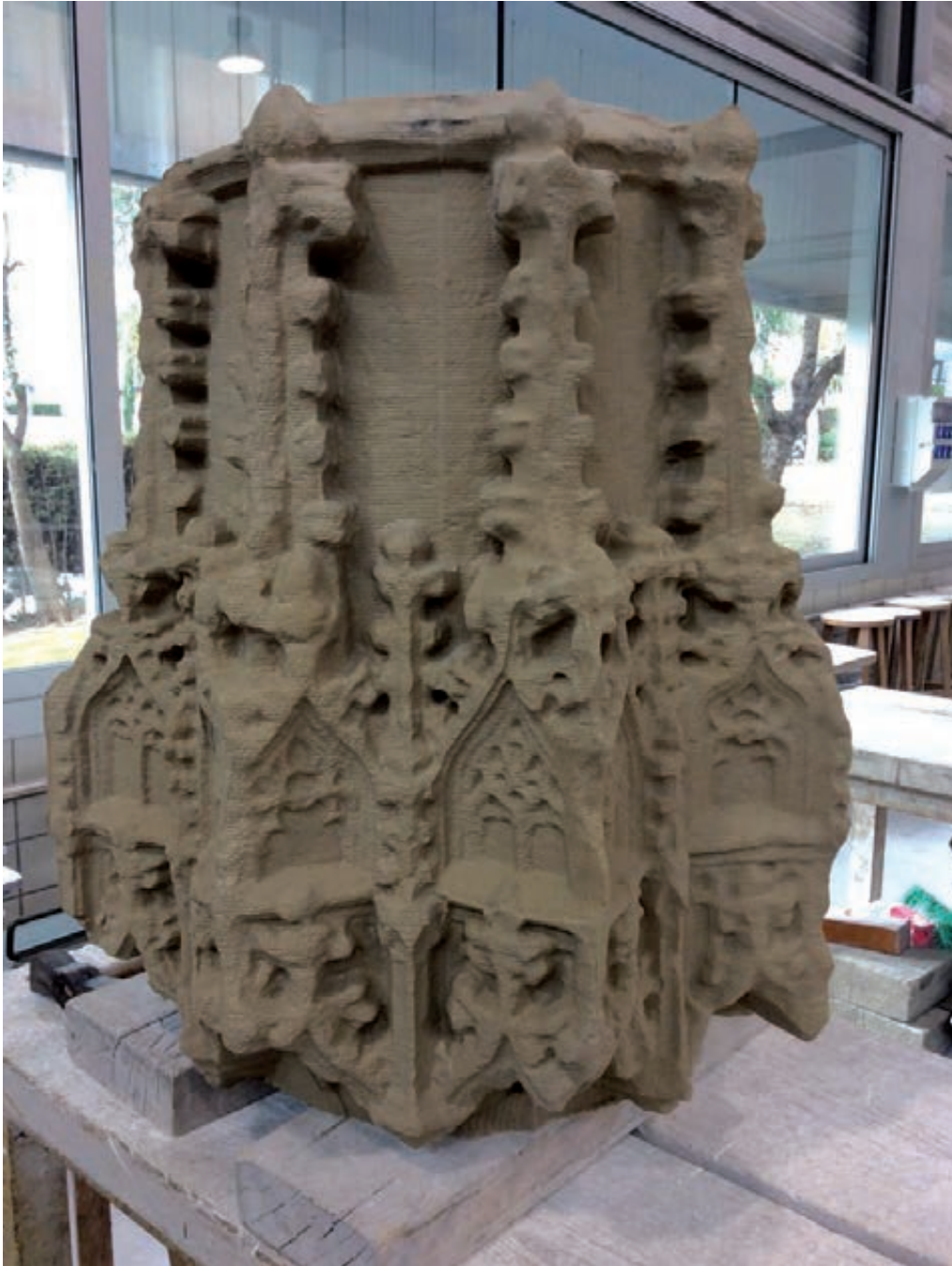
Figura 8. Resultat del treball de mecanitzat.

Després del treball de mecanitzat, la peça queda amb una textura ratllada com a resultat del treball de mecanització, i encara li falta algun mil·límetre per arribar a la superfície definitiva de la forma. El robot no ha pogut accedir a tots els racons de la peça a causa de l'angle d'entrada de la fresa, de manera que aquest treball queda per a l'escultor, així com acabar de donar forma a tota la peça eliminant l'última capa fins a arribar a la forma definitiva.