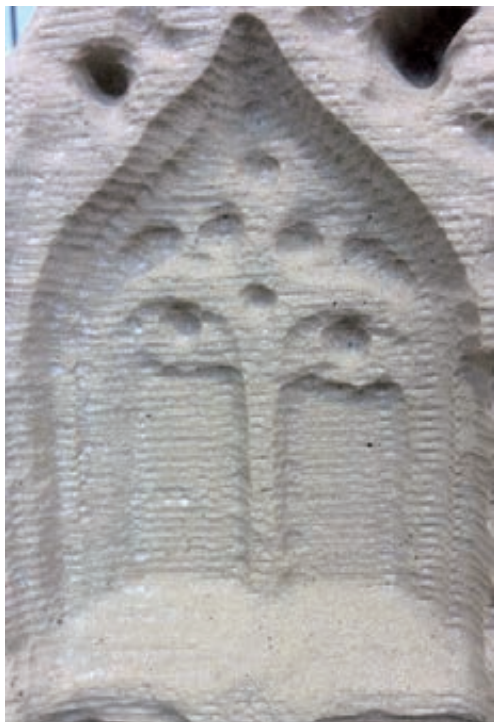
Figures 9 i 10. Detall de la peça acabada de mecanitzar i un resultat del treball manual.