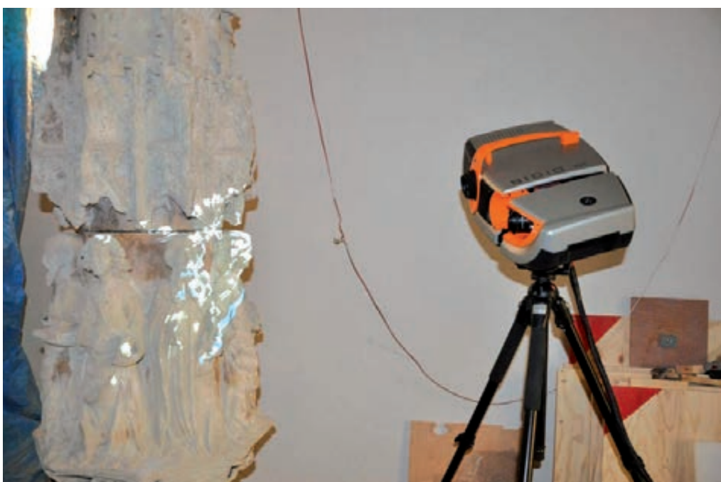
Figura 5. Projeccions de les bandes de llum.

Els resultats es poden exportar en format ASCII i STL i són totalment compatibles amb diferents programes de tractament de núvols de punts.