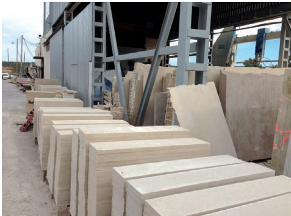
Figura 2. Pedres Magami, a Vinaixa, proveïdor del material per a la rèplica.

quins processos tècnics es faran servir en el projecte. Moltes vegades, aquest depèn de l'objectiu per al qual hagi de ser usada la rèplica. Si és una substitució a l'exterior, és molt important realitzar-la amb el mateix tipus de material, sempre que sigui possible trobar-lo.