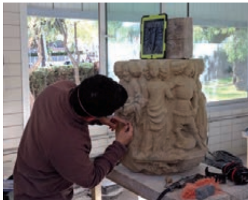
Figura 14. Treballs d'acabat.

En aquest cas, el que crec que han revelat els treballs d'acabat és que els fragments