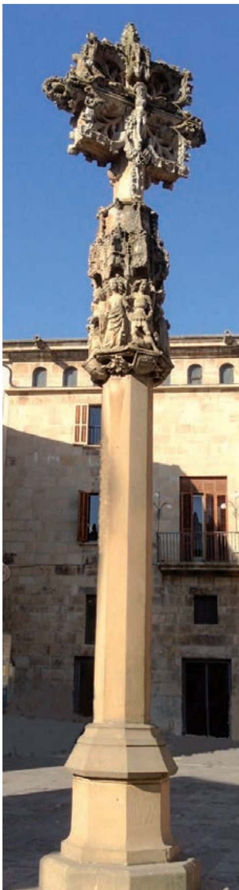
Figura 1. Creu de terme.

El material que s'utilitzarà per fer una rèplica és un factor important a l'hora de decidir