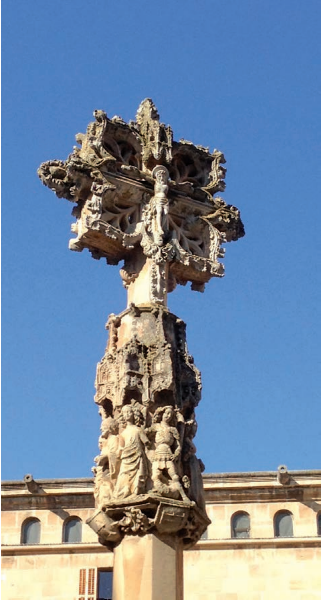
Figura 19. Magolla original.