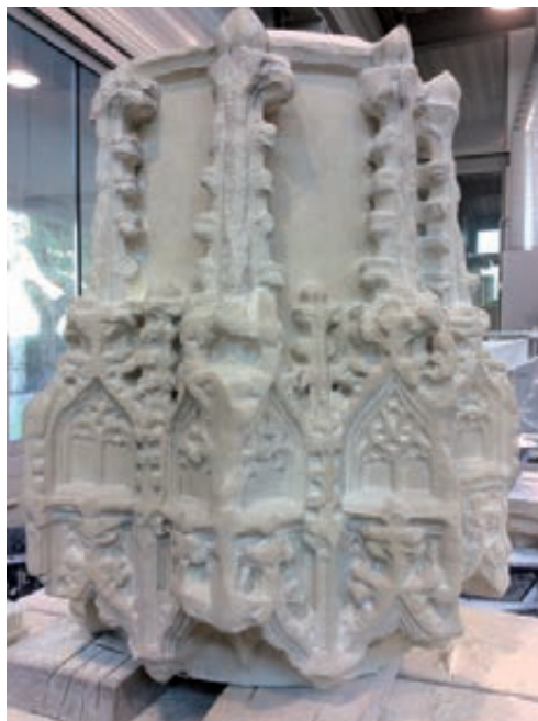
Figura 15. Peça acabada.