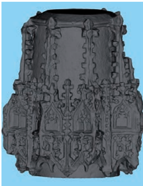
Figura 6. Visualització de l'arxiu digital.