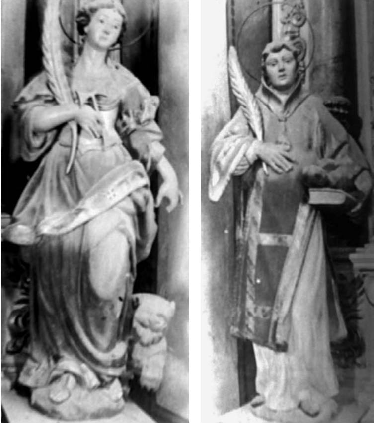
Fig. 3. Santa Tecla i Sant Esteve. Retaule de Santa Tecla i Sant Esteve.