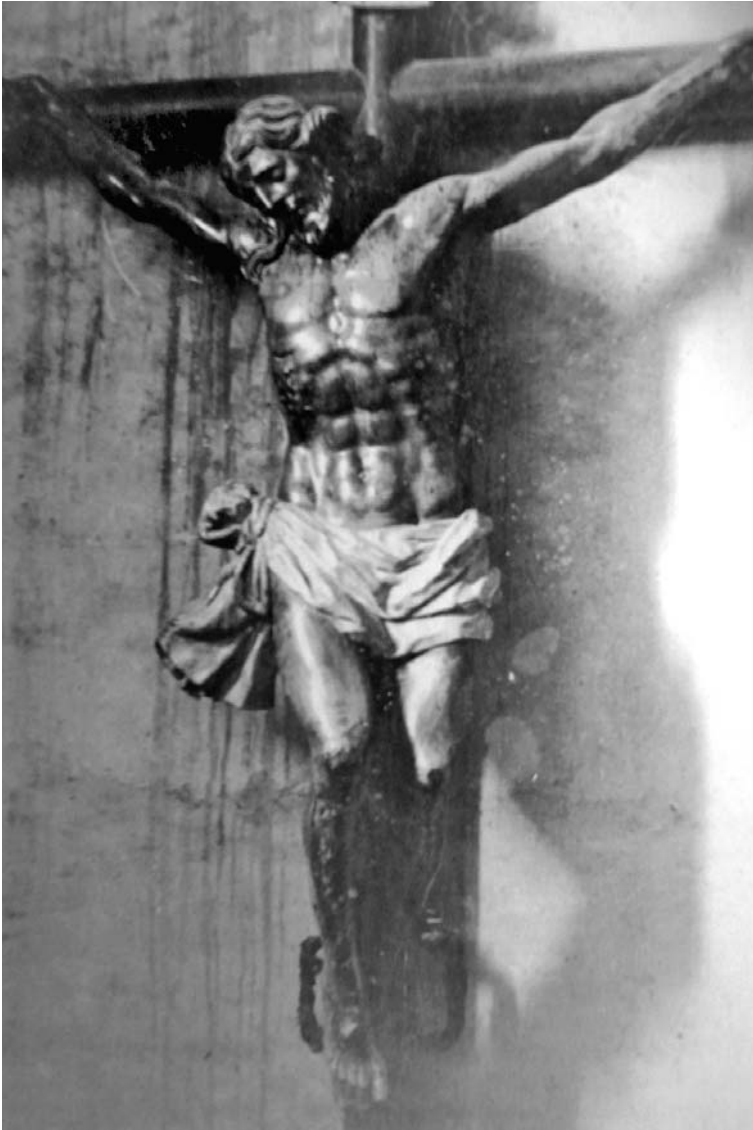
Fig. 5. Sant Crist.