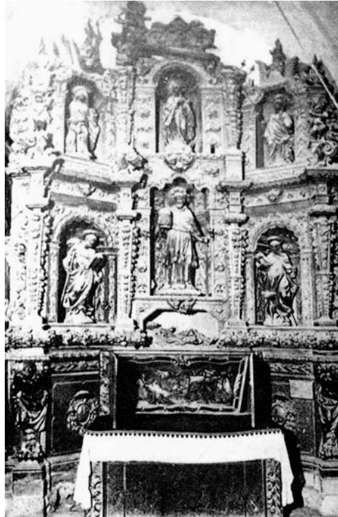
Fig. 2. Retaule de Sant Ramon Nonat.

causa d'una de les guerres que hi hagué al llarg del segle XIX s'incendià part de l'interior del temple, cremant-se aquest retaule i d'altres, contractant-ne un de nou. És el que reproduïx al seu llibre i que s'encarregà a l'escultor lleidatà Hermenegild Jou (Lleida, 1830-1915), la segona meitat del segle XIX i que ell mateix cita en la pàgina 108: "L'altar nou, fet per l'escultor de Lleyda Ermenegil Jou, fá pochys anys ab les mateixes imatges antigües fetes de nou, y d'estil romá ó modern acomodat al de la fábrica..."