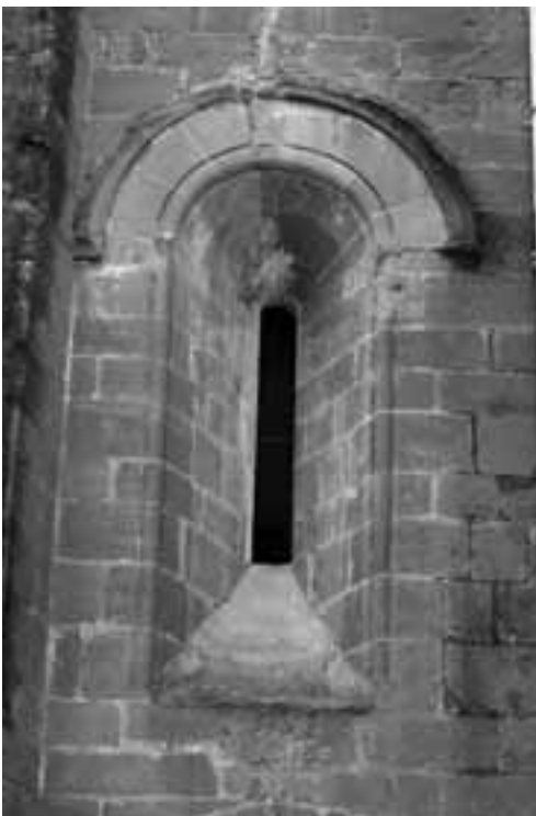
Finestra de l'antic presbiteri romànic (s. XIII).