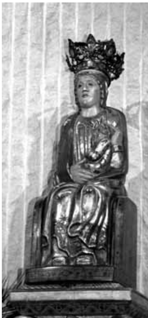
Maredeú del Merli. Talla actual, renovada.

La imatge de la Maredeú que es venera actualment al santuari del Merli és pot quasi afirmar que és una rèplica, o millor una recreació, de l'original, que seria del segle XIII. Ho fa suposar sobretot la tradicional disposició en Maiestas Domni , emperò ja ressaltant el seu caràcter humà de mare. Val a dir que la persistència d'una iconografia romànica, pròpia del segle XII, en talles marianes del segle XIII i, àdhuc, en molts casos del segle XIV, és un tret que caracteritza moltes de les representacions que es feren arreu del nostre país en aquesta mateixa època, i a les terres de Lleida molt especialment. Es poden citar com a exemples notoris de dites talles de fusta, les de la Maredeú de Santa Maria de Cubells, 31 la de Sant Salvador de Vilanova de Meià 32 i la que es venera a l'església de l'antic monestir de Santa Maria de