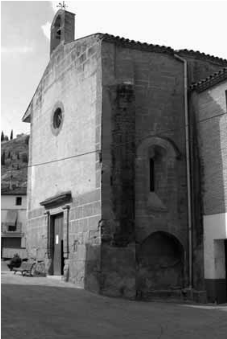
Maredeu del Merli. Façana barroca actual i una de les finestres de l'antic presbiteri romànic.