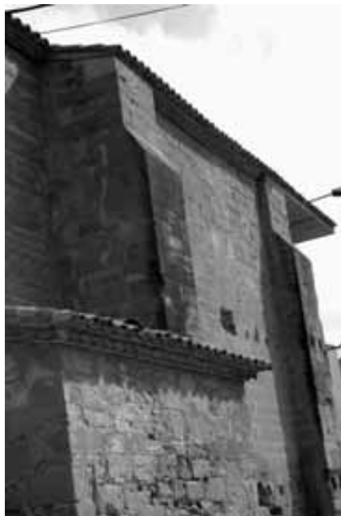
Detall dels contraforts esglaonats del costat meridional del temple (s. XIII).