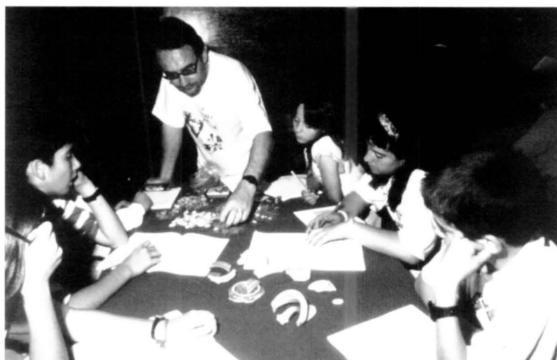
Classificació dels materials i elaboració de les dades

• En relació al coneixement de l'arqueologia, previ a la realització del taller, encara que les respostes són molt variades, s'aprecia un desconeixement bastant generalitzat. Es poden fer dos grups: els qui donen una resposta positiva, d'apreciació de l'activitat, i els qui en tenien una visió negativa. Entre aquests darrers, el grup majoritari és el que trobava l'arqueologia una matèria avorrida.