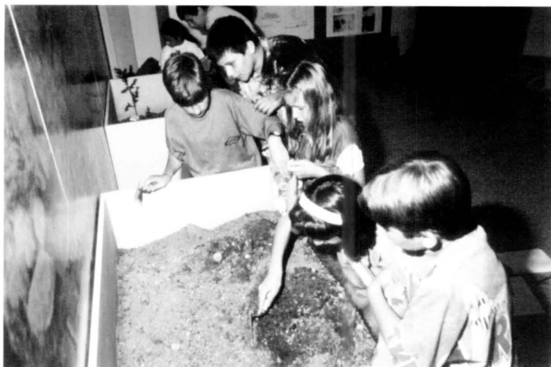
Un dels grups excavant el seu sector del "jaciment"