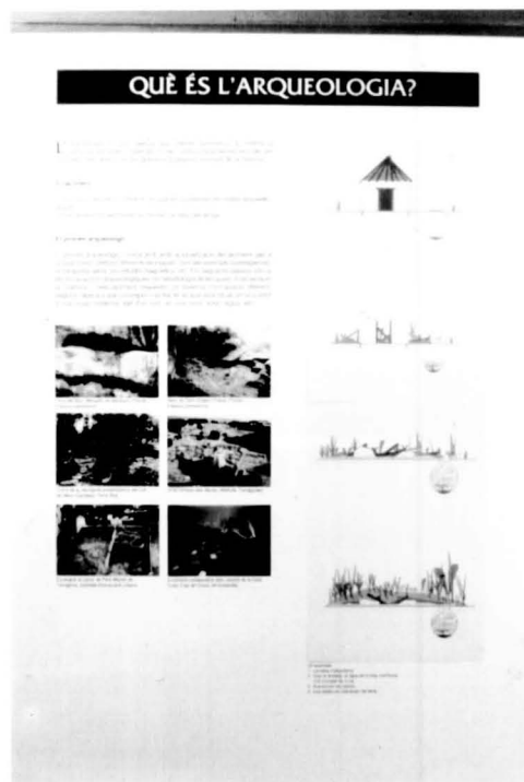
Detall d'un dels plafons informatius al voltant de «Què és l'arqueologia?»

Una vegada tots els grups han realitzat l'estudi del seu "jaciment", hi ha una posada en comú de les dades i la redacció d'unes conclusions finals.