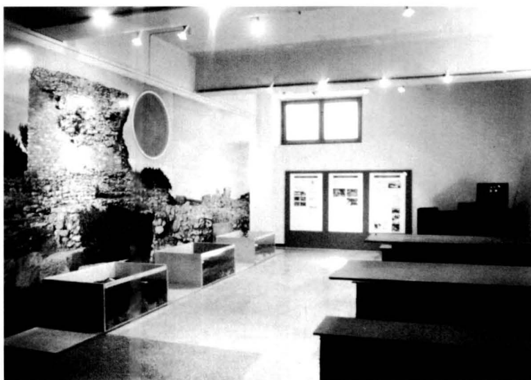
Vista general del Taller d'Arqueologia, ubicat en una de les sales del Museu Nacional Arqueològic de Tarragona

En el moment de plantejar la creació d'aquest taller es va considerar necessari assolir un seguit d'objectius, tant generals com específics. Entre els primers podríem citar el nostre interès per portar l'arqueologia a l'escola, perquè els alumnes coneguessin i entenguessin l'arqueologia com una eina per a fer història. D'altra banda també era important que s'arribés a entendre que l'arqueologia es fonamenta en l'anàlisi dels productes i vestigis físics (objectes, estructures, estrats, etc.) generats per l'activitat humana dins dels seu entorn. Els alumnes han de comprendre que les accions humanes (no totes, però sí una bona part) deixen una empremta física que -a través