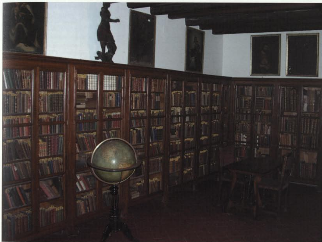
Sala de la biblioteca on es conserva el fons bibliogràfic particular d'Eduard Toda i Güell.

Les torres que adornen el conjunt no tenen res a veure amb l'edifici original. La part més notable és l'església, de pedra rogenca, consagrada el 1240, romànica de transició.