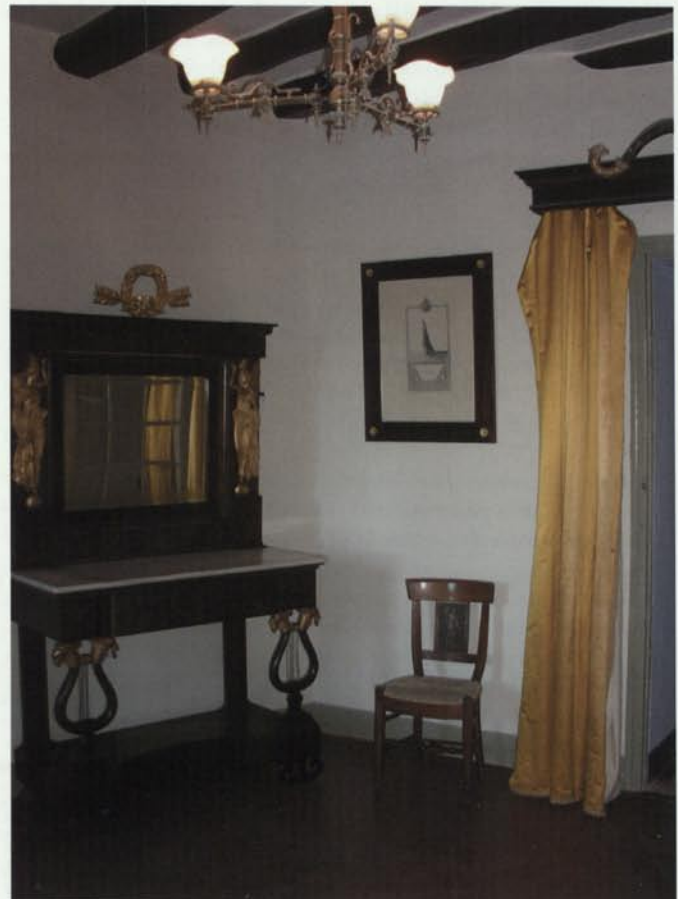
Zona de pas de l'Ala Conventual amb mobiliari d'estil imperi i gravat de l'època (Fotografia: M. Àngels Balliu).

6 Segons el decret del 22 d'abril (BOE 5-5-1949), pel qual es protegeixen tots els castells d'Espanya. Posteriorment, segons la nova llei 16/1985 del 25 de juny del Patrimoni Històric Espanyol (disposició especial segona) passà a ser "Bé d'Interès Cultural".