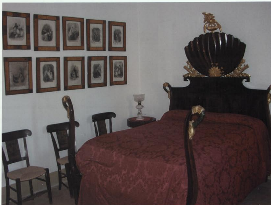
Habitació d'estil imperi amb la col·lecció de gravats "Costumbres del Universo", alguns d'ells restaurats per l'especialitat de Conservació i Restauració del Document Gràfic de l'ESCRBCC.

Els alumnes de l'especialitat de Conservació i Restauració del Document Gràfic, al llarg de sis cursos, han restaurat un total de trenta-nou gravats 5 emmarcats dels segles XVIII i XIX, entre estampes calcogràfiques, xilografies i litografies, moltes d'elles acolorides, i de temàtiques diverses: paisatges (la majoria de les comarques tarragonines), escenes religioses, costumistes, retrats, etc.