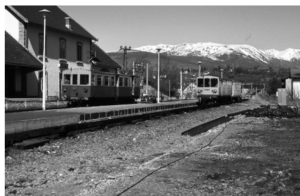
El petit tren groc recorre la major part dels pobles de l'alta Cerdanya

Un altre camp on pot haver-hi cooperació i desenvolupament transfronterer és l'esportiu, no tant en l'aspecte lúdic o competitiu, com en el sentit més purament econòmic. Font-romeu, per exemple, té unes instal·lacions molt conegudes d'alta muntanya. També la baixa Cerdanya podria oferir infraestructures d'alt rendiment esportiu, en un entorn d'altura, saludable i immillorable en molts aspectes per a la pràctica de molts esports, estades, etc.