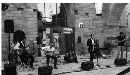
Acte del Festival Transfronterer

Totes aquestes coses estan fent possible la creació d'una veritable xarxa transfronterera, si bé la cosa està molt lluny encara d'un desenvolupament òptim.