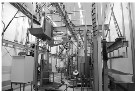
Interior de l'Escorxador Transfronterer, a Ur

Fet i fet, és habitual que al costat espanyol, quan cerques un treball de cara al públic, et demanin no només el domini del català i del castellà, sinó que també és important conèixer el francès. A l'altre costat de la frontera, passa una mica el mateix, si bé no