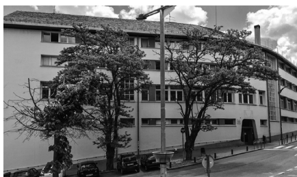
INS Pere Borrell, Puigcerdà