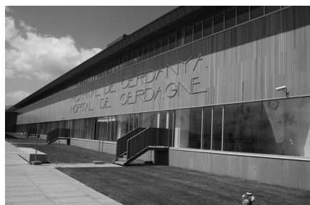
Vista exterior de l'Hospital Transfronterer, Puigcerdà