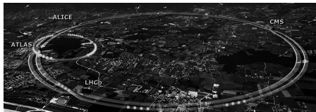
CERN, a la frontera entre Suïssa i França, a prop de Ginebra