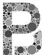
Cartell anunciador del Festival Transfronterer

FESTIVAL TRANSFRONTERER PUIGCERDÀ BOURG-MADAME