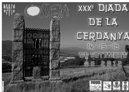
Cartell anunciador de la Diada de Cerdanya de l'any 2012

L'altre model és el tecnològic, que es dona a la frontera francosuïssa, amb instal·lacions com el CERN. És evident que Europa no ens construirà una infraestructura tan gran i costosa com el gran col·lisionador d'hadrons a la nostra vall, però s'hi poden instal·lar altres entitats molt més petites, lligades al món científic i universitari. A mig camí entre Tolosa i Barcelona, seria un lloc ideal per viure-hi, investigar i treballar.