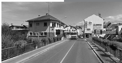
Pont internacional. Conurbació de Puigcerdà-Bourg-madame