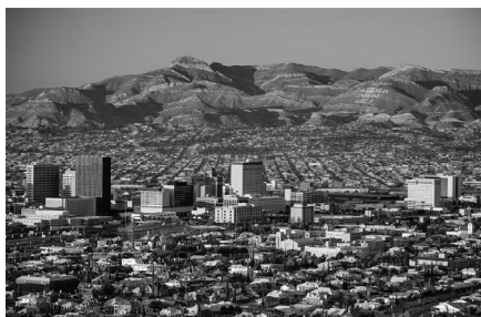
Ciutat d'El Paso, a la frontera entre els EUA i Mèxic