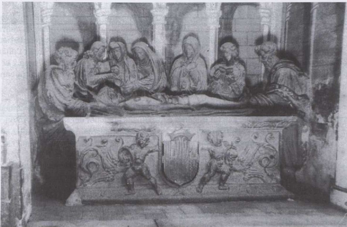
Fotografia de l'altar.

I la setena diu: " 81 libras y cuatro sueldos a mestre Enrique Ferrer cerrajero de la ciudad de Lérida, por una rexa para la tribuna de la Iglesia ". Aquest està datat al 10 d'octubre de 1622.