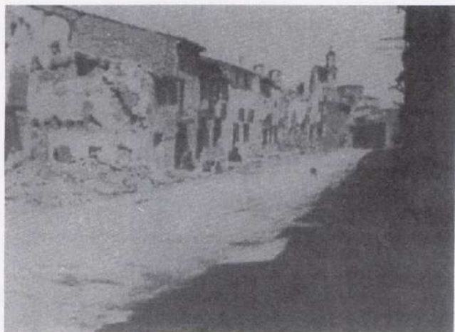
Carrer Sant Pere