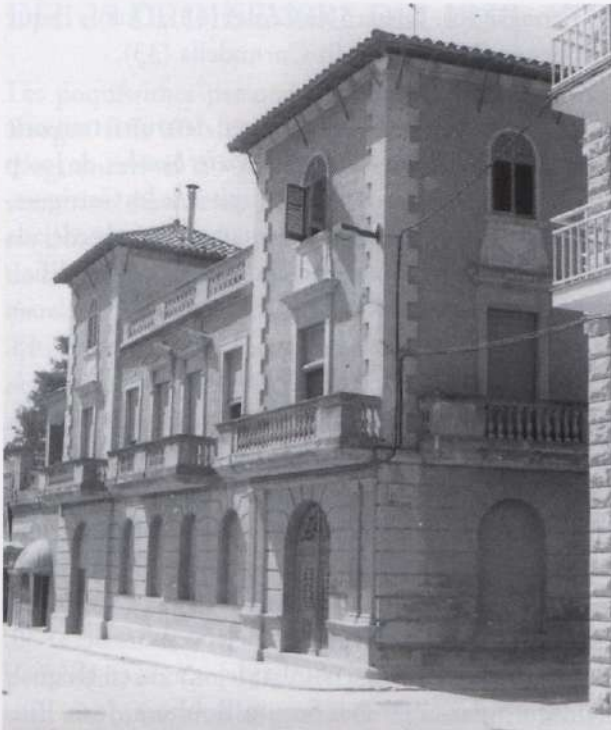
Cal Paco, edifici on estava instal·lat l'Estat Major de l'Exèrcit Republicà.

Per protegir la població civil i les forces militars, es construïren alguns refugis, en els carrers següents: dos