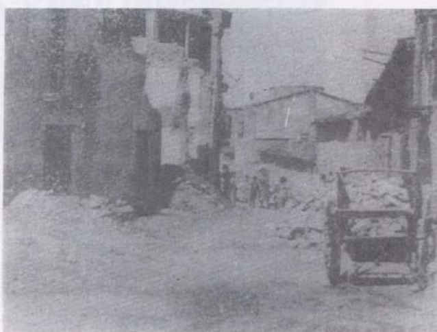
Carrer Sant Pere