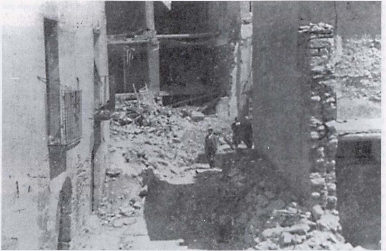
Edificis del carrer Josep Soler destruïts durant un atac aeri realitzat pels 'Junkers' alemanys.