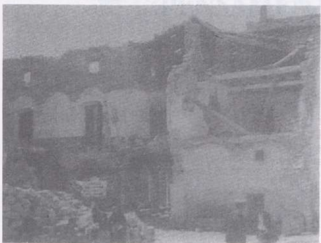
Convent de les Monges