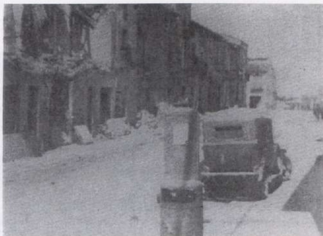
Carretera de Lleida