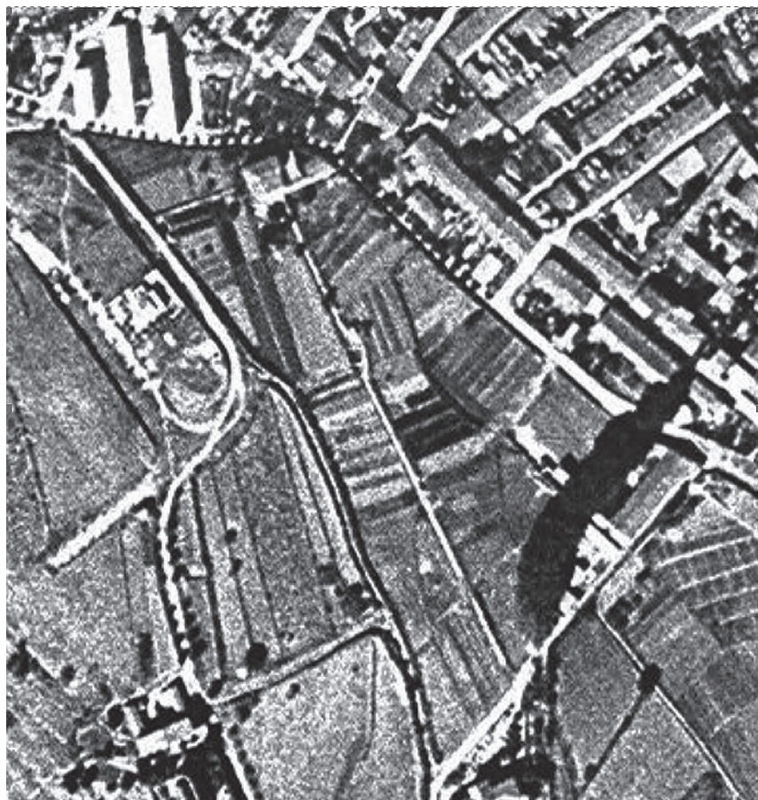
Vista aèria de can Salvat l'any 1956, just en el moment de l'inici de la urbanització.