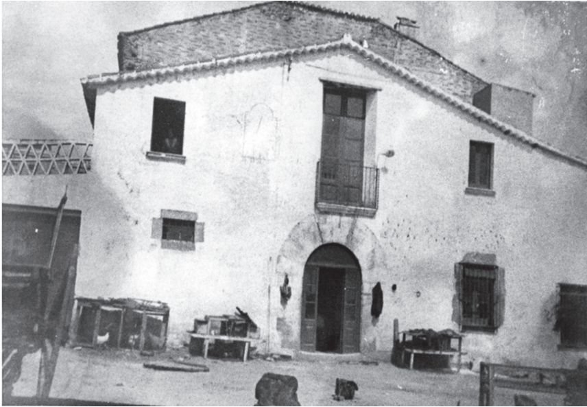
Can Salvat a principis del segle XX segons imatge de Josep Piferrer

nom amb què ha passat a la memòria local. 55 D'altra banda, compraven als fills hereus de Jaume Pons de Vall per subhasta per tres mil lliures la casa i gleva de sis quarteres de can Pons de Vall abans Pons i Eroles. 56 Tota la propietat tornava a estar sota el llinatge descendent de can Pons dels Arbres, abans Pons i Eroles. Però havia estat un salt excessiu: L'any 1772, el nou propietari Sebastià Font i Salvat s'ho havia de vendre tot per pagar deutes.