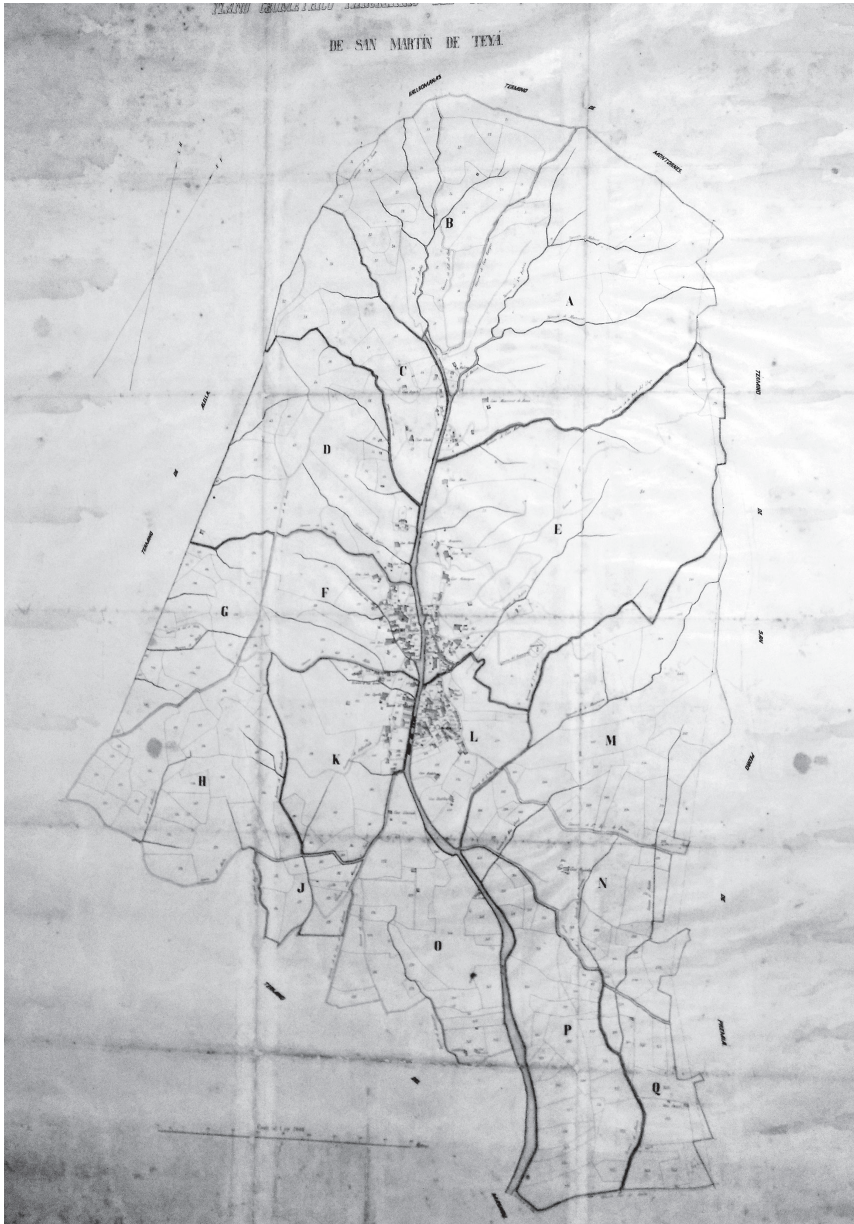
ACM. Fons Ajuntament de Teià. Plànol de l'amillament de Teià. (1865)