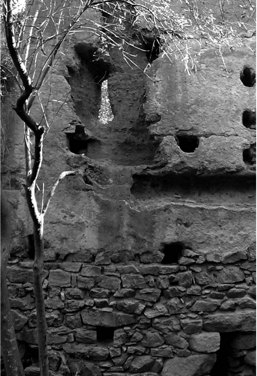
Costat nord des de l'interior.