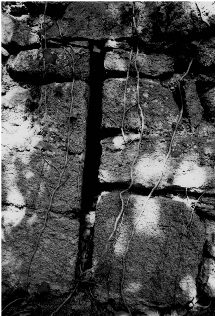
Espitllera del costat sud el 1998.