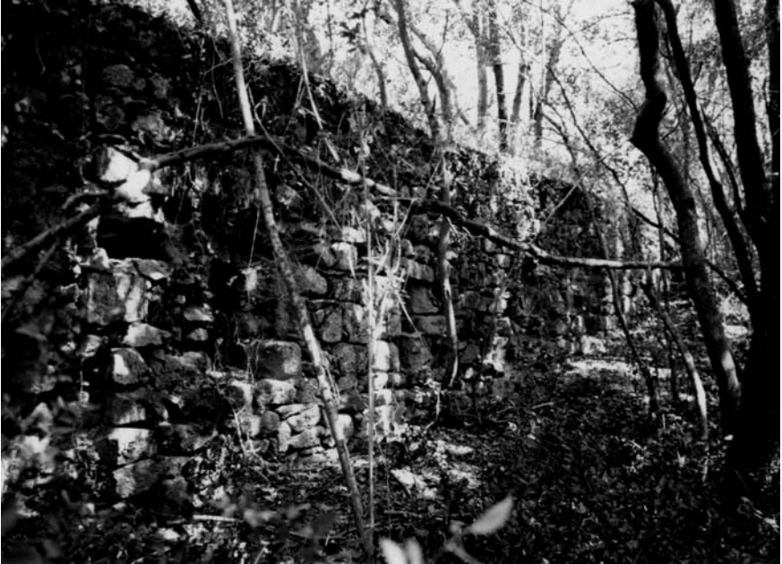
Mur de llevant amb el nivell de mur de pedra i el de tàpia.