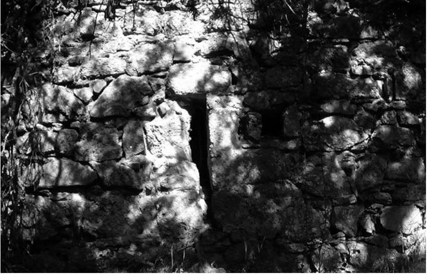
Espitllera del costat sud malmesa per degradació recent. El forat del costat delata l'extracció d'una pedra.