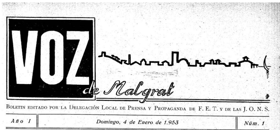
Caràtula del primer número de la revista Voz de Malgrat, editada de 1953 a 1968

Un personatge polifacètic, realment tossut i alhora que rebel, conservador. La passió per la terra, la llengua, la història, el poble, les costums i la seva gent, les herbes remeieres i la botànica en general, tot això acompanyat d'un gran servei desinteressat a la divulgació de les múltiples aficions que va conrear, són el resultat del valor del seu llegat, divers però eficient, que configura un cúmul d'informació que va condensar i compartir amb el pas del temps. Tota aquesta ciència i història que va recopilar, la feia extensiva mitjançant el canal de premsa local la Voz de Malgrat , on anava publicant articles divulgatius des de l'any 1953 fins al 1968, data de la seva mort. També va fer articles sobre Malgrat a diversos programes de la Festa Major de Sant Roc i la de Sant Nicolau.