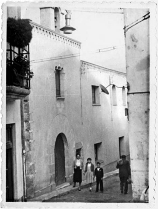
Fotografia dels anys seixanta, on s'aprecien les reformes realitzades el 1960. L'Abans, recull gràfic de Tordera (1870-1979).

La capella també està vinculada amb l'activitat política local. Durant l'Alta Edat mitjana, Tordera era una zona independent encara que sense constituir terme de castell. Temps després, aquest territori fou conegut com a batllia de Tordera . La jurisdicció, composta per dues parròquies, Sant Esteve de Tordera i Sant Cebrià de Fogars, no disposava d'una organització de regisme local i conservava un sistema de consell general obert i multitudinari. Políticament era representada per un batlle i disposava de membres del consell de la universitat, sense tenir un caràcter hereditari. Primerament, els llocs habituals de la reunió de la universitat eren la porxada o l'interior de l'església de Sant Esteve. La capella de l'hospital dels pobres, també fou sala de reunions del Comú del poble al segle XVIII.