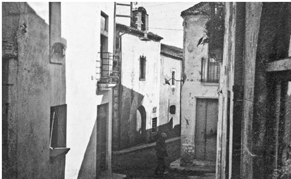
Capella de Sant Antoni i de l'antic hospital dels pobres de Tordera. Any 1942

centre cultural. S'hi ubicà la Biblioteca Municipal i locals de determinades associacions, com la Nostra Dansa, Club Filatèlic Tordera, Caps de família de Tordera o el Club d'Escacs Tordera